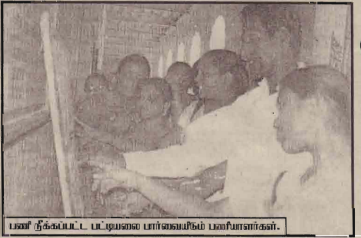
பணி நீக்கப்பட்ட பட்டியலைப் பார்வையிடும் பணியாளர்கள்.

அதேநேரம், சாலைப் பணியாளர் தற் கொலை; மருத்தவர் போராட்டத்தால் தோயாளிகள் மரணம்; ஊழியர், ஆசிரியர்கள் போராட்டத்தால் மரணம்... என்பன தமிழக முதலமைச்சர் ஜெயலலிதாவின் ஆட்சியில்தான்