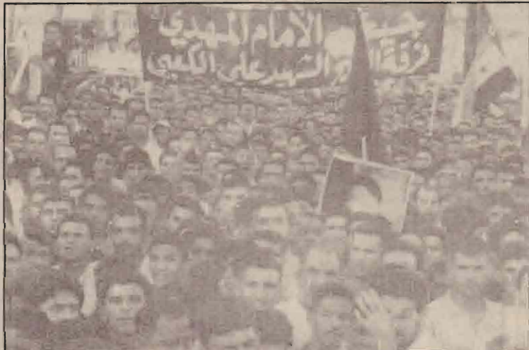
முன்னாள் சராக்கிய சனாதிபதியால் 1999இல் கொல்லப்பட்ட ஷியா முஸ்லிம் தலைவர் அலீ அல் காயியின் நினைவுநாள் நிகழ்வின் போது திரண்டுள்ள ஷியா முஸ்லிம் ஆதரவாளர்கள்.

இதையடுத்து எதிர்க்கட்சிகள் கொண்டு வந்த நம்பிக்கையில்லாத் தீர்மானம் தோல்வியடைந்ததாக சபாநாயகர் மனோகர் யோஸி அறிவித்தார்.