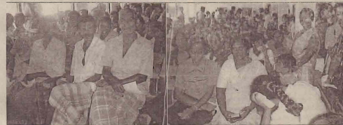
காணக் கூடியதாகவுள்ளது. தினமும் 700க்கும் மேற்பட்ட நோயாளிகள் இவ் வைத்தியசாலையில் வெளிநோயாளர் பகுதிகளில் சிகிச்சை பெற்றுச்

செல்வதனை அவதானிக்கக் கூடியதாகவுள்ளது. வைத்தியசாலையில் நிலவிவரும் வைத்தியர் பற்றாக்குறை காரணமாக நேரடி வெளிநோயாளர் பகுதியில் பெருந்திரளான