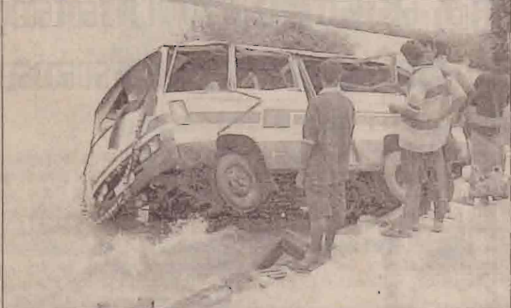
காயமடைந்தவர்களில் 12பீர் பெண்களும், 16பீர் ஆண்களுமாவார்கள். இவர்கள் தற்போது மட்டக்களப்பு போர்தள வைத்தியசாலையில் சிகிச்சைக்காக அனுமதிக்கப்பட்டுள்ளனர்.

மட்டக்களப்பிலிருந்து வாழைச்சேனை நோக்கி சென்று கொண்டிருந்த விமானம் ஒன்று வான் ஆற்றில் வீழ்ந்ததில் 20ற்கும் மேற்பட்ட பயணிகள் காயமடைந்துள்ளனர்.