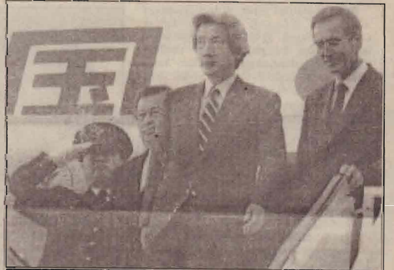
சர்வதேச பொருளாதாரம், பயங்கரவாதம் என்பவை தொடர்பாக வர்சோவில் பேச்சு நடத்த வரலாக தரும் ஐப்பாணியப் பிரதமர் ஜெர்சிரோ கொய்சாவி விமானத்திலிருந்து இறங்குகிறார்.

சென்னையில் நேற்று முன்தினம் நடைபெற்ற ஐ.கே. முப்பனார் பிறந்த நாள் விழாக்கூட்டத்தில் இதனைக் கூறியுள்ளார்.