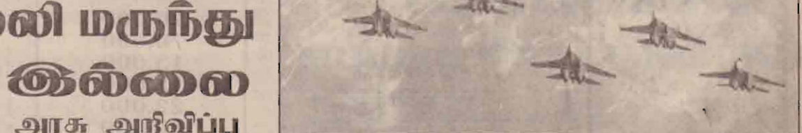
ரஷ்யாவின் சுக்காய்-27 யுத்த விமானங்களின் சாகச நிகழ்ச்சி.