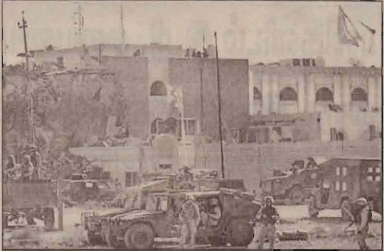
தற்கொலைத் தாக்குதலுக்குள்ளான ஈராக்கிலுள்ள ஐ.நா. தூதரகம்