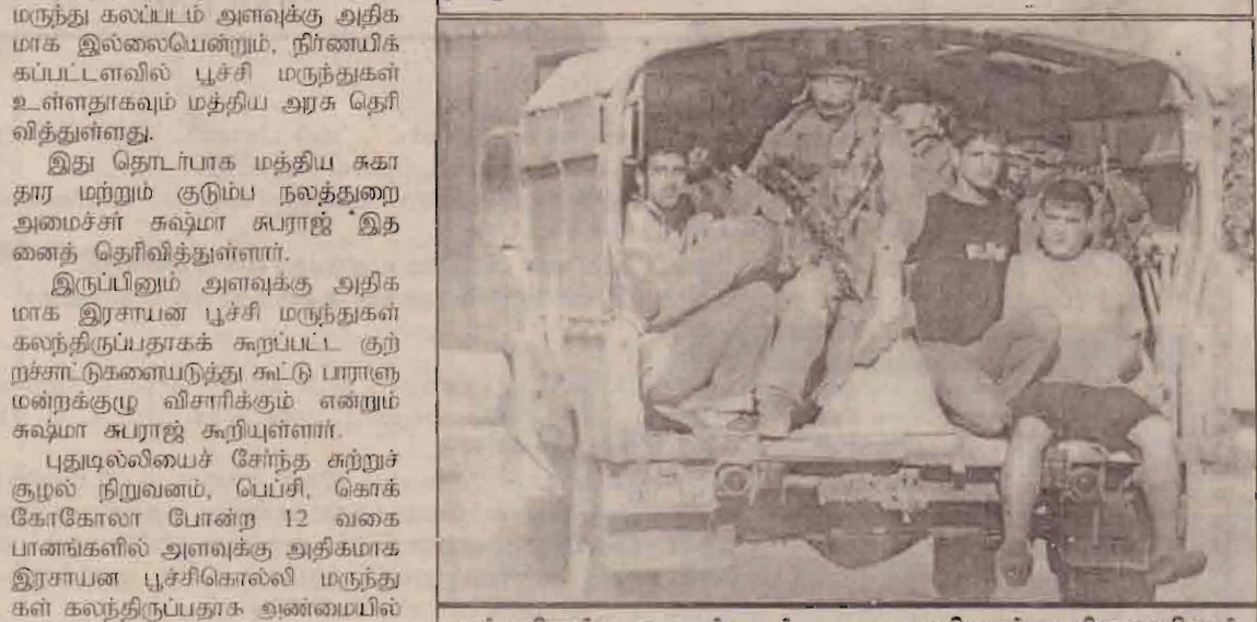
யுத்தநிறுத்த உடன்படிக்கை அமுலில்லாத நிலையிலும் மேற்குக்கரை-ஜெப்லஸ் பகுதியில் இஸ்ரேலிய இராணுவத்தினர் பலஸ்தீன இளைஞரை கைது செய்து பறக்கல் ஏற்றிச் செல்கின்றனர்.