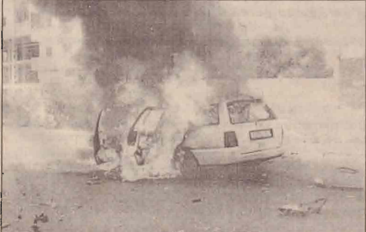
இஸ்ரேலிய கெல்க்கொப்டரின் ஏவுகணைத் தாக்குதலுக்குள்ளாகி எரிந்த கொண்டிருக்கும் கமாஸ் தீர்வாதிகள் பயணித்த காள்.

(புதுடில்லி) பெப்சி, கொக்கோகோலா உள்ளிட்ட 12 வகையான குளிப்பானங்களில் அரசு நிர்ணயித்துள்ள அளவிலேயே இரசாயன பூச்சிகொல்லி மருந்துகள் இருப்பதாக மத்திய அரசு பாராளுமன்றத்தில் நேற்று தெரிவித்துள்ளது. பெப்சி, கொக்கோகோலா உள்ளிட்ட 12 வகையான குளிர்