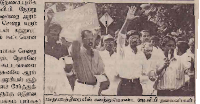
பாதயாத்திரையில் கலந்துகொண்ட ஜே.வி.பி. தலைவர்கள்

இடைக்கால நிர்வாகத்தை துப்பி விடுதலைப் புலிகளுக்கு வழங்கக்கூடாது என்று ஜே.வி.பி. நேற்று காவலில் ஆர்ப்பாட்டப் பாதயாத்திரை ஒன்றை ஆரம்பித்துள்ளது. இது பல கிராமங்களுடாகச் சென்று வரும் வியாழக்கிழமையன்று கொழும்பு லிட்டன் சர்வதேசத்தைச் சென்றுவந்து அங்கு பொதுக் கூட்டமொன்றும் நடைபெறவுள்ளது.