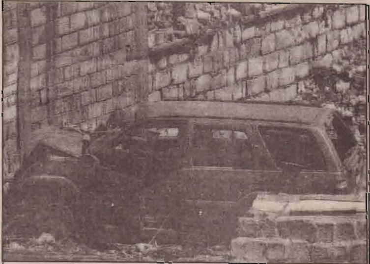
பஸ்ராவில் பிரிட்டிஸ் படையினர் மீது கடந்த சனியன்று நடத்தப்பட்ட தாக்குதலில் மிக மோசமாக சேதமடைந்த வாசனம். இத்தாக்குதலில் 3 படையினர் பலியானனர்.

நிக்கோ என்ற பிரதேசத்திலேயே இக்குண்டு வெடிப்பு இடம் பெற்றுள்ளது. 56 பயணிகளுடன் சென்ற இந்தப் படகில் இடம் பெற்ற இந்தக் குண்டு வெடிப்பிற்குக் கொலம்பிய நாட்டுத் தீவிரவாதிகளே காரணமென்று அந்நாட்டு அரசு தெரிவித்துள்ளது.