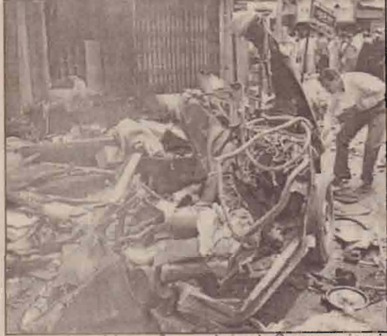
வங்கனும், வந்தக நிலையங்களும் சேதமடைந்தன என.

இந்தியாவின் மும்பாய் நகரின் இரண்டு இடங்களில் கார் குண்டு வெடிப்புக்கள் இடம்பெற்றுள்ளன. இக்குண்டு வெடிப்புக்களில் 65 இரும் மேற்பட்டோர் கொல்லப்பட்டதோடு 150 இற்கும் அதிகமானோர் காயமடைந்துள்ளனர். பல வாக