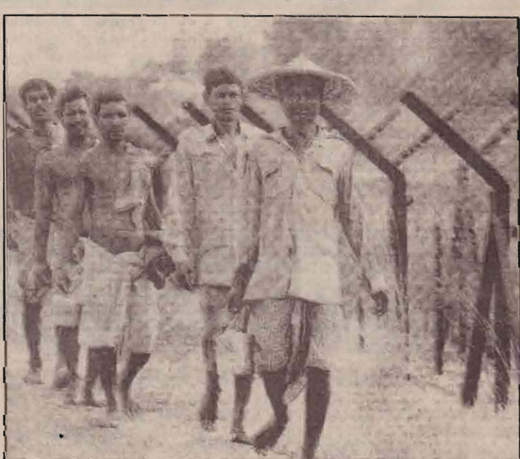
இந்திய பங்களாதேஷ் எல்லையாகுகே தமதுவேலைகளை முடித்துவிட்டு வடு திரும்பும் கீராம வாசிகள்

(புதுடில்லி) மத்திய அமைச்சரவையில் மாறுதல்கள் குறித்துப் பிரதமர் வாஜ்பாய் முக்கிய அமைச்சர்கள், பாரதிய ஜனதா தலைவர்களுடன் நேற்று முன்தினம் ஆலோசனை நடத்தியுள்ளார். இந்த வாரத்தில் மேற்கொள்ளப்படவுள்ள அமைச்சரவை மாற்றங்கள், மாநிலங்களவைகளில் நிரப்பப்படவுள்ள 08 நிபமன உறுப்பினர்கள் பதவிகளுக்கு யார் யாரை நியமிக்கலாம் என்பது குறித்தும் இந்தக் கூட்டத்தில் விவாதிக்கப்பட்டதாகக் கூறப்படுகின்றது. காங்கிரஸ் தலைவர் மம்தா பனாஜி, பாரதிய ஜனதாவைச் சேர்ந்த தனஞ்செயக்குமார், செளபாசிங் ஆகியோர் மீண்டும் தேசிய அமைச்சரவையில் சேர்த்துக் கொள்ளப்படலாம் என்று அதிகார பூர்வ வட்டாரங்கள் தெரிவித்துள்ளன.