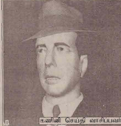
கணினி செய்தி வாசிப்பவர்

அதேபோல் எழுத்துப் பிழைகள், இலக்கணப் பிழைகள், சரியான குறியீடுகளை இடாமல், சொற்களுக்கிடையே இடைவெளிபின்மை, தெளிவற்ற வசனங்கள், மயக்கமான சொற்கள், வசனங்கள் என்பனவற்றை இம் மென்பொருள் குரல் வழியாகச் சுட்டிக் காட்டும்.