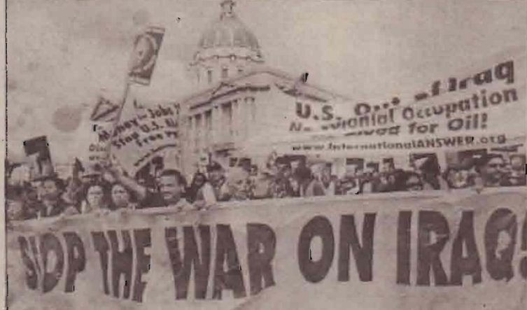
சான் பிரான்ஸிஸ்கோ நகரில் 10 ஆயிரம் மக்கள் பங்கேற்று ஈராக் போருக்கெதிரான ஆர்ப்பாட்டம் நடவடிக்கை.

உத்தரப்பிரதேச அரசியல் முடிவுக்கு வந்துள்ளது. புதிய முதலமைச்சராக முலாயம் சிங் யாதேவ் முதலமைச்சராக பதவியேற்கவுள்ளார். பரபரப்புடன் காணப்பட்ட உத்தரப்பிரதேச மாநில அரசியலில் முக்கிய திருப்பமாக சமாஜ்வாதிக் கட்சித்தலைவர் முலாயம் சிங் யாதேவ் முதலமைச்சராகப் பதவி ஏற்கவுள்ளார். உத்தரப்பிரதேச முதலமைச்சர் மாயாவதி பதவி விலகியதையடுத்து மாற்று அரசு ஏற்படுத்தும்மாநிலச் சட்டமன்றத்தில் தனிப்பெரும் கட்சியாக விளங்கிய சமாஜ்வாதிக் கட்சி முயற்சி மேற்கொண்டது. அதற்கு காங்கிரஸ், ராஜ்யிய காந்திதளம் உட்பட சில கட்சிகள் ஆதரவு வழங்கியதையடுத்து மாநில ஆளுனரிடம் முலாயம் சிங் ஆட்சியமைக்கக் கோரியிருந்தார். மேலும், தனக்கு ஆதரவு வழங்கும் அமைச்சர்களின் பட்டியலையும் வழங்கியுள்ளார். இதனையடுத்து ஆளுனர் முலாயம் சிங் யாதேவ்வை புதிய அரசு அமைக்குமாறு கேட்டுக் கொண்டுள்ளார். அதேநேரம், மாயாவதியின் பகுஜன் சமாஜ்கட்சியிலிருந்து ஆறு அமைச்சர்கள் உட்பட பதினொரு எம்.ஏ.க்கள் விலகி முலாயம் சிங் யாதேவ்வுக்கு ஆதரவு வழங்கியுள்ளார்கள்.