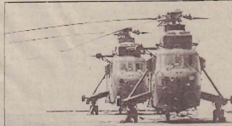
ஈரிட்டனின் றோயல் கடற்படைக்குச் சொந்தமான 105 மி.மீ துப்பாக்கி பொருத்தப்பட்ட எம்.கே.4 உலங்குவானூர்தி.

அதிக அதிகாரம் வழங்கும் வகையில் ஆட்சிமுறையை மாற்ற வேண்டுமென்று முதல்மைச்சர் செல்வி ஜெயலலிதா வலியுறுத்தியுள்ளார். ஆனால், தமிழக முதல்மைச்சர் இந்தக் கூட்டத்தில் கலந்துகொள்ளவில்லை. அவரது சார்பில் இக்கூட்டத்தில் நிதியமைச்சர் பொன்னையன், முதல்மைச்சரின் உரையை வாசித்துள்ளார். இதனிடையே பிரதமர் வாஜ்பாய் ஸ்ரீநகருக்கு செல்வதற்கு முன்னரும், சென்ற பின்னரும் வீடுகளில் கைக்குண்டுகள் வெடித்துள்ளன. இதில் பாதுகாப்பில் ஈடுபட்டிருந்த 04 பொலிசார் காயமடைந்துள்ளார்கள். தற்போது பாதுகாப்பு பலப்படுத்தப்பட்டுள்ளது.