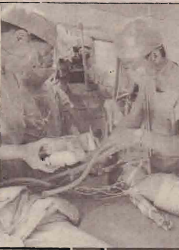
பீஜிங் வைத்தியசாலையில் 15 மாதக் குழந்தையின் சுவது கானல் நீக்கும் சத்தி சிகிச்சையில் ஈடுபட்டுள்ள வைத்தியர் குழு.