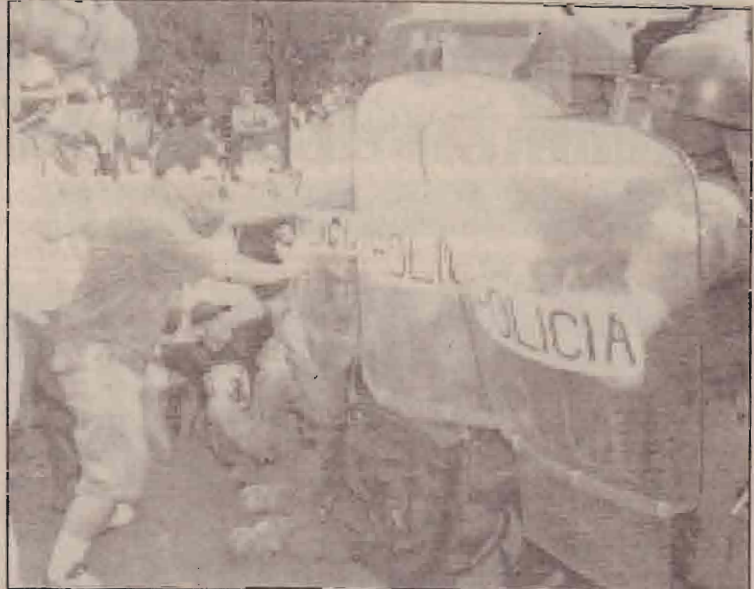
சராக் யுத்தம் தொடர்பாக அமெரிக்காவிற்கு ஆதரவு வழங்குவரும் கொஸ்ராஹா அரசிற்கெதிராக அந்த நாட்டு மக்கள் நடத்தும் ஆர்ப்பாட்டத்தையும் இதை அடக்க முற்படும் கொஸ்ராஹா பொலீஸும்.

வடகொரியா அணுவாயுதங்களை வடிவமைத்துத் தருவதாக அமெரிக்கா முன்வைத்த குற்றச்சாட்டுக்களின் அடிப்படையில் எழுந்த சர்ச்சையைத் தீர்ப்பதற்காகவே இப்பேச்சு வார்த்தைகள் நடத்தப்பட்டமை குறிப்பிடத்தக்கது.