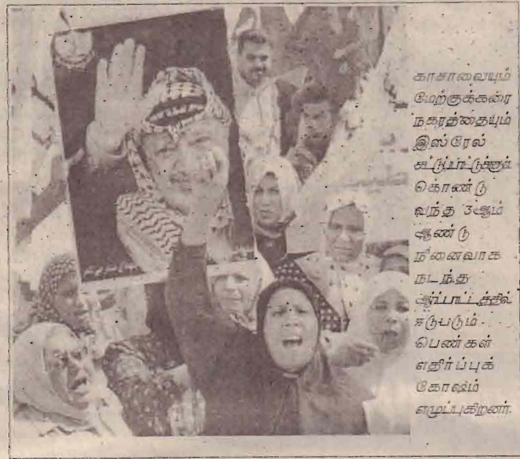
காசாவையும் மேற்குக்கரை நகரத்தையும் இஸ்ரேல் சுட்டுப்படுத்தக் கொண்டு வந்த 3-ஆம் ஆண்டு நினைவாக நடந்த ஆர்ப்பாட்டில் கலந்துகொண்ட பெண்கள் எதிர்ப்புக் கோஷம் எழுப்புகிறார்கள்.

இஸ்ரேல் அணுவாயுதங்களை வைத்திருப்பதாக, பரவலாக பேசப்படுகின்றது. ஆனால் அணுவாயுத பயன்பாடு தொடர்பான எந்தவொரு முக்கிய உடன்படிக்கையிலும் கைச்சாத்திடவில்லை. என்றும் அவர் குற்றம் சாட்டியுள்ளார்.