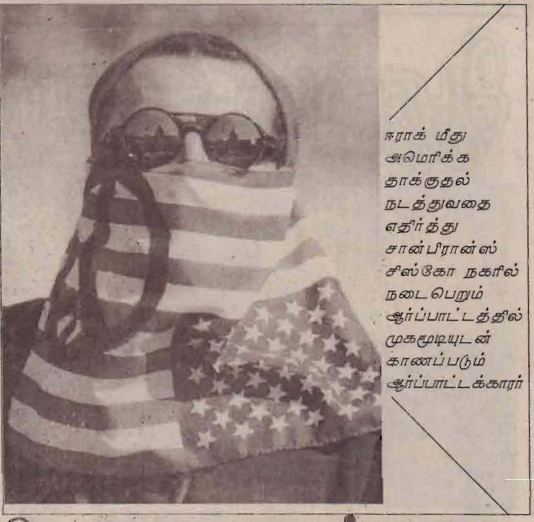
சிராக் மீது அமெரிக்க தாக்குதல் நடத்துவதை எதிர்த்து சான் பிரான்ஸிஸ்கோ நகரில் நடைபெறும் ஆர்ப்பாட்டத்தில் முகமூடியுடன் காணப்படும் ஆர்ப்பாட்டக்காரர்

புறப்பட்ட போது தீக்குச்சியை யாரோ எரியச் செய்தபோது இந்த ஏற்பாடு அவர் விட்டைச் சூழ்த்தலை குறிப்பிடத்தக்கது.