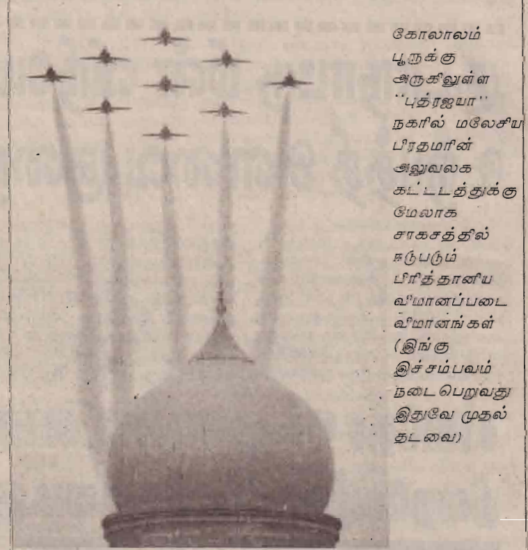
கோலாலம் பூநக்கு அருகிலுள்ள "புத்ரஜயா" நகரில் மலேசிய பிரதமரின் அலுவலக கட்டடத்துக்கு மேலாக சாகசத்தில் கடுபடும் பிரித்தானிய வீமானப்படை வீமானங்கள் (இங்கு இச்சம்பவம் நடைபெறுவது இதுவே முதல் தடவை)

யாற்றிய மியன்மாரின் வெளிவிவகார அமைச்சர் இக் குற்றச்சாட்டை கூறியுள்ளார். ஆனால் வைத்தியசாலை யிலிருந்து விடுவிக் கப்பட்டு விட்டுக் காவலில் தடுத்து வைக்கப்பட்டிருக்கம் எதிர்க்கட்சி தலைவர் சூகி பற்றி அவர் எதிர்ப்புக் கூறவில்லை.