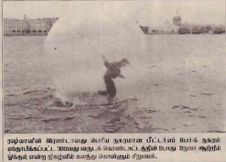
ரஷ்யாவின் இரண்டாவது பெரிய நகரமான பீட்டர்ஸ் பேர்க் நகரம் ஸ்தாபிக்கப்பட்ட 300வது வருடக் கொண்டாட்டத்தின் போது நகரம் ஆற்றில் ஓங்குல் என்ற நிகழ்வில் கலந்து கொள்ளும் சிறுவன்.

களுக்கு எதிராக கிளர்ச்சியாளர்கள் மேற்கொண்ட நடவடிக்கையில் நாட்டின் பெரும் பகுதி கிளர்ச்சியாளர் வசம் வீழ்ந்த நிலையில் அமைதியை ஏற்படுத்த அங்கு மேற்காபிரிக்க அமைதிப்படை போய்ச் சேர்ந்திருந்தது எனினும் ஆட்சியாளர்களுக்கும், கிளர்ச்சியாளர்களுக்கும் இடையில் இன்னமும் ஓர் இணக்கப்பாடு காணப்படாத நிலையில் மீண்டும் இரத்தக் களறி வர்ப்பும் அபாயம் ஏற்பட்டுள்ளமை குறிப்பிடத்தக்கது.