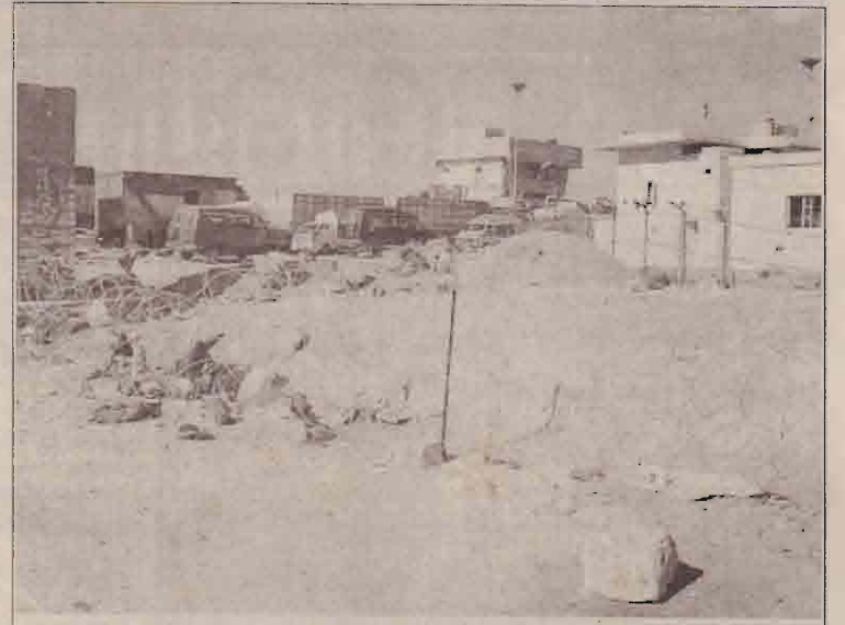
தீவிரம் அமெரிக்கப் படைகள் மீது தாக்குதல் நடத்தும் ஈரக்கியர்கள் மறைந்துபோன இடமாகக் கருதப்படும் சிரியா என்ஸையிலிருக்கும் ஈரக்க பிரதேசத்துள் சென்றுவரும் வாகனங்கள்.

பொலீஸியாவில் "ஹுமை ஒழிக்கப்பட வேண்டும்" எனக் கூறி ஆசிரியர்களும் தொழிலாளர்களும் நடைபாதை வியாபாரிகளும் ஆர்ப்பாட்டங்களை நடத்தியுள்ளனர். ஏற்கனவே இந்நாட்டில் இருவாரங்களாக வேலை நிறுத்தம் நடைபெற்று வருகின்றமை குறிப்பிடத்தக்கது.