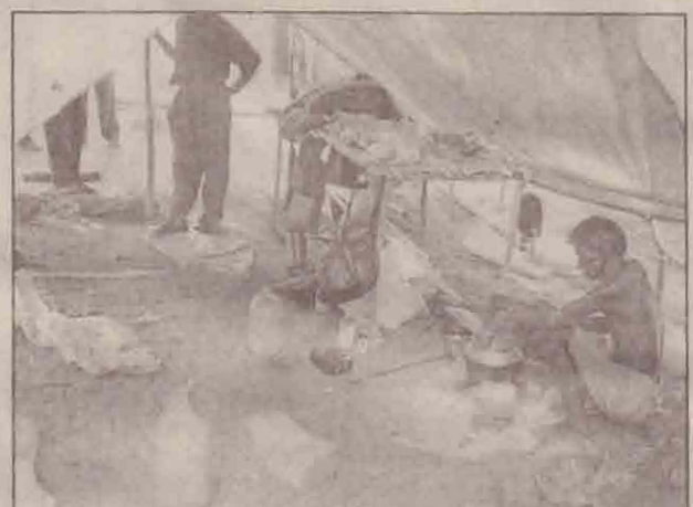
எதிர்பார்ப்பு வேலை வாழ்கின்றனர்.

ஒதியமலைக் கிராம மக்கள் அகதிகளாக்கப்படும்போது அவர்களது சொத்துக்கள் பறிக்கப்படும் போது, அவர்களது உயிர்கள் பறிக்கப்படும்போது இவர்களுக்கு தான்கு, ஐந்து வயது தான் இருந்திருக்கும். ஏதாவது அறியாத பாலகர்கள், இப்போது அந்த இடத்தைப் பார்த்துப்போது அந்த மக்களின் உணர்வுகளைப் பகிரும்போது எனக்குப் புல்லித்தது. அன்று இத்தனை துயரங்களை அடைந்த இந்த மக்களின் நிலங்கள் மீண்டும் 18 வருஷங்களில் பின்னர் மீட்கப்பட்டபோதும் அவர்களின் கிராமம் வேகமாகக் கட்டிபெழுப்பப்பட்ட கடின நிலை இல்லை. இந்த மக்களின் எதிர்காலச் சந்ததியின் சிறந்த வாழ்விற்கு கல்வி போதிப்பதற்கு ஒரு சிறிய பாடசாலை இல்லை. மக்களின் தேவை