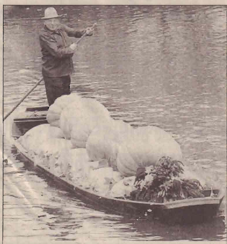
தமது பாரம்பரிய படகு மூலம் பூசணிக்காய்களை காரியாட்ட நிகழ்வு ஒன்றுக்கு கொண்டி செல்லும் வியூபிபனா நாட்டு விவசாயி.

எமது கடலின் அடியில் அணு அடித்து இருக்கக்கூடாது. முழுகிய கப்பலிலிருந்து அணுக்கசிகளின் எதுவும் இடம்பெறா விடாமல், அதனை அகற்றிவிடுவதே சிறந்ததாகும் என ரஷ்ய அரசு அறிவித்துள்ளது. ஆனால் நீர் முழுகியை வெளியில் கொண்டுவரும் விதம் பற்றி ரஷ்யா இதுவரை அறிவிக்கவில்லை. ஆகஸ்ட் 30 ஆம் திகதி k.159 என்ற ரஷ்ய நீர் முழுகிக் கடலில் முழுகியமை தெரிந்ததே. இதில் ஒருவர் மட்டுமே உயிர் தப்பியமை குறிப்பிடத்தக்கது.