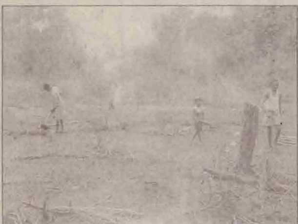
அவ்வாறு தனது காணியைத் துயரவு செய்து கொண்டிருந்த ஒரு முதியவரின் அருகில் சென்று அவருடன் உரையாடினோம்.

தமிழ் மக்கள் ஆண்டாண்டு காலமாக பரம்பரை பரம்பரையாக வாழ்ந்து வந்த கிராமத்தில் தமது சொந்த நிலத்தில் இருந்து விரட்டப்பட்டு 18ஆண்டுகள் சுழிந்துவிட்டது. செழிப்பாகவும், வளமாகவும் வாழ்ந்த மக்கள் ஏறாம நிலைக்குத் தள்ளப்பட்டு ஏதிலிகள் ஆக்கப்பட்டனர். அவர்களை உறவினர்கள், பிள்ளைகள் குதறுப்பட்ட பெரும் துயரமான சம்பவம் இப்பகுதி மக்களின் மனங்களில் இப்போதும் குடிசென நின்று. அந்நி வாழ்வின் அத்தியாயங்கள் இவர்களின் வாழ்வில் அப்படித் தவிராக மாறிவிட்டது. ஒதியமலைக் கிராமம் தற்போது பெரும் பற்றைகளைக் கால்கள் தருகின்றது. ஆம் காங்கே மக்கள் பற்றைகளை வெட்டிக்கொண்டிருந்தனர்.