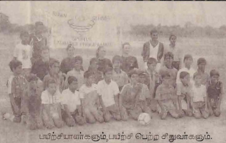
பயிற்சியாளர்களும், பயிற்சி பெற்ற சிறுவர்களும்.

வில் ம.வி. பளை மத்திய கல்லூரி ஆகியவற்றைச் சேர்ந்த 60 சிறுவர்கள் கலந்துகொண்டனர். இப்பயிற்சி செயற்திட்டமானது 3 வருட காலத்தைக் கொண்டதாக அமையும் எனவும், இதன் மூலம் உதை பந்தாட்டத்தின் தரத்தை கிளிநொச்சி யில் உயர்த்துவதற்கு திட்டமிடப்பட்டுள்ளதாகவும் தெரிவிக்கப்பட்டது. தொடராக நடாத்தப்படவுள்ள இச் செயற்திட்டத்தை நடைமுறைப் படுத்துவதற்காக 10 உதைபந்தாட்டப் பயிற்றுனர்களும் தெரிவு செய்யப்பட்டுள்ளனர். இச் செயலம்மை பயனுள்ளதாக ஆக்குவதற்கு மேற்குறித்த பாடசாலைகளின் அதிபர், ஆசிரியர்கள், பழைய மாணவர்கள், கல்வித்திணைக்களம் என்பன பக்கபலமாக அமைய வேண்டும் எனவும் விளையாட்டுத்துறைப் பொறுப்பாளர் வேண்டுகோள் விடுத்துள்ளார். இச் செயற்திட்டத்தினோடு மானவருக்கும், பயிற்றுனர்களுக்கும் மேலதிக தொடர்புபயிற்சிகள் வழங்கப்படும் எனவும் தெரிவிக்கப்பட்டுள்ளது.