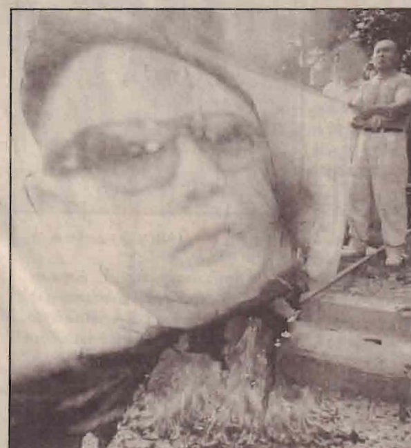
வடகொரியாவை அணு வாயுத் தயாரிப்பதற்கு உறுதுணையாக மாறுகோரி தென் கொரிய தலைநகர் சியோவில் வடகொரிய சனாதிபதியின் உருவப்படத்தை தீயிட்டுக் கொடுத்தும் ஆர்ப்பாட்டக்காரர்.

சந்தேகிக்கப்படும் ஆந்திரா பிரதேசப் பொதுவுரிமை குழுவைச் சேர்ந்தவர்கள். அத்துடன் இவர்கள் இக்குண்டு வெடிப்பிற்கு காரணமாக கருதப்படும் மக்கள் போர்க் குழுவும் தொடர்புடையவர்களென சந்தேகிக்கப்படுவதாக ஆந்திராப் பொலிசார் தெரிவிக்கின்றனர்.