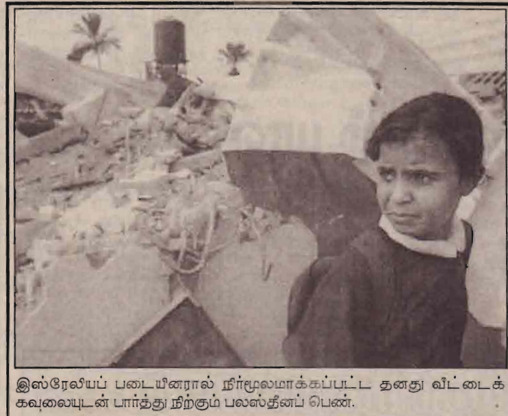
இஸ்ரேலியப் படையினரால் நீர்மூலமாக்கப்பட்ட தனது வீட்டைக் கவலையுடன் பார்த்து நிற்கும் பலஸ்தீனப் பெண்.

இது தொடர்பாக யாருமே கைது செய்யப்படவில்லை என்பதுடன் விசாரணைகளுக்கூட நடைபெறாமல் வழக்கு முடிக்கப்பட்டது. இந்த சோக சம்பவத்தின் 35ஆவது நினைவு தினம் நேற்று அனுஷ்டிக்கப்பட்டது.