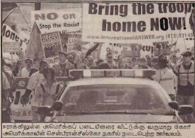
ஈராக்கிலுள்ள அமெரிக்கப் படையினரை வீட்டுக்கு வருமாறு கோரி அமெரிக்காவின் சென்ட்ரான்சீஸ்கோ நகரில் நடைபெற்ற ஊர்வலம்.