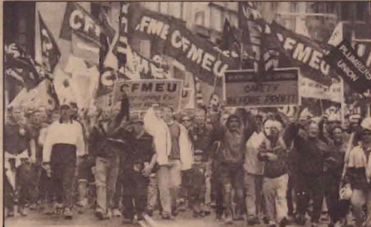
சி.நியில் அவுஸ்திரேலியப் பிரதமர் ஜோன்கவாட்டின் விட்டிற்கு முன்னால் அரசு தொழிலாளர் உரிமைகளைக் குறைக்க எடுக்கும் முயற்சிக் கெதிராகவும் தொழிலாளருக்குத் தொழில் பாதுகாப்பு வழங்குமாறும் கோரி கட்டிடத் தொழிலாளர் மேற்கொண்டுள்ள ஊர்வலம்.

நவம்பர் மாதம் நடைபெறவுள்ள தேர்தலுக்கு வழிவகுக்கும் நோக்குடன் இந்நடவடிக்கை எடுக்கப்பட்டுள்ளது. பிரதமரின் சீர்திருத்தத் திட்டங்களுக்கு மக்கள் ஆணை கிடைக்குமா? என்பதைச் சோதிக்கும் பரிட்சையாகத் தேர்தல் களம் அமையவுள்ளது. இவர் 2001 ஆம் ஆண்டு ஆட்சியில் ஏறியமை குறிப்பிடத்தக்கது. அப்போது அவரது சீர்திருத்தக்கொள்கைகளுக்குத் தீவிர ஆதரவு கிடைத்தது. அந்நாட்டின் பொருளாதாரம் மறுமலர்ச்சி அடைந்து வரும் வேளையில் கீழ்ச்சபையின் பெரும்பான்மைப் பலத்தைத் தக்கவைத்துக் கொள்வதே பிரதமரின் ஆளும் கட்சித் தலைமையிலான கூட்டணியின் நோக்கமாகக் காணப்படுகிறது.