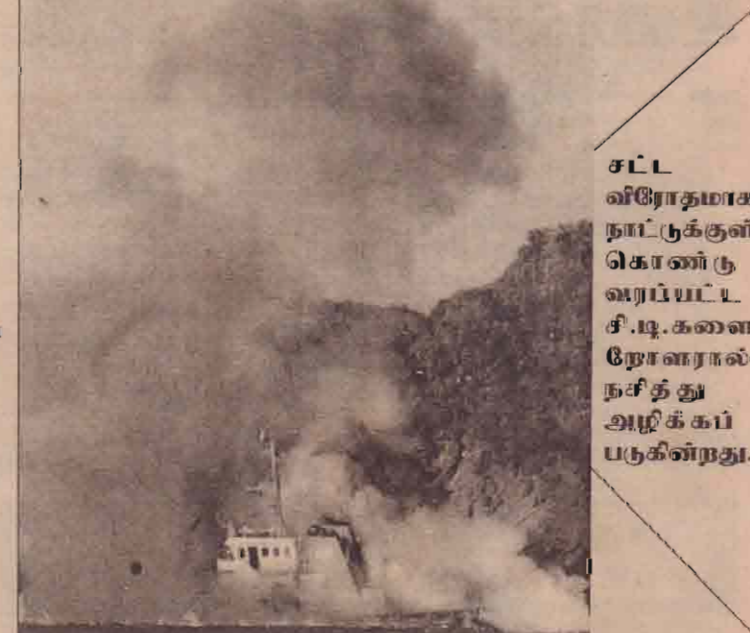
சட்ட விரோதமாக நாட்டுக்குள் கொண்டு வரப்பட்ட சி.டி.களை நோளரால் நசித்து அழிக்கப் படுகின்றது.

தகவல் அறிந்ததும் சம்பவ இடத்திற்கு விரைந்து வந்த மீட்பும் படையினர்: காயமடைந்தவர்களை மீட்டுள்ளனர்.