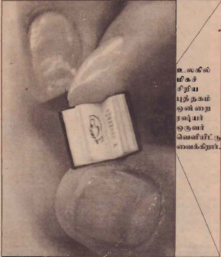
உலகில் மிகச் சிறிய புத்தகம் ஒன்றை ரஷ்யர் ஒருவர் வெளியிட்டு வைக்கிறார்.