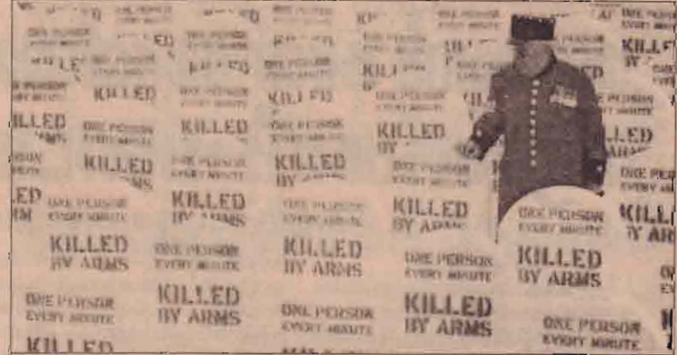
உடை அடித்த வீரர்களை நாடுகளை பிரான்ஸ், ரஷ்யா, சீனா பிரிட்டன், அமெரிக்கா ஆகிய நாடுகளை ஆயுதங்கள் விநியோகம் செய்யாமல் கட்டுப்படுத்துமாறு கோரும் இயக்கத்தின் உறுப்பினர் மத்திய ஸ்டாண்டிஸ்டிங் மயானம் ஒன்றினூடாக நடந்து செல்கிறார்.

இந்த முன்னைச்சரிக்கை அமைப்பை பெறுவதன் மூலம் இந்தியா 800-2000கிலோமீற்றர் தொலைவிலிருந்து ஏற்படக்கூடிய வான்வெளி அச்சுறுத்தலை கண்டறிய முடிவதுடன் அதனை தவிர்த்துக்கொள்ளவோ முடியும்கூடாது.