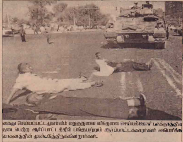
கைது செய்யப்பட்ட முஸ்லிம் மதகுருவை விடுதலை செய்யக்கொள்வார்களா? பாக்குத்தின் நடைபெற்ற ஆர்ப்பாட்டத்தில் பங்குபற்றும் ஆர்ப்பாட்டக்காரர்கள் அமெரிக்க வாக்களத்தில் முன்பகத்திற்குக்கின்றார்கள்.

அத்தோடு அமெரிக்க ஆதரவினான ஈராக்கிய ஆளுநர் சபை பிரதி நிதிகளும் இந்த உச்சி மாநாட்டில் பங்குபற்றக் கூடுமென மாநாட்டு வட்டாரங்கள் தெரிவித்துள்ளன.