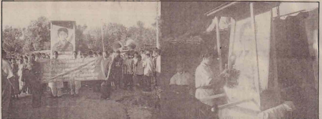
வவுனியாவில் நடைபெற்ற எழுச்சி நிகழ்வு