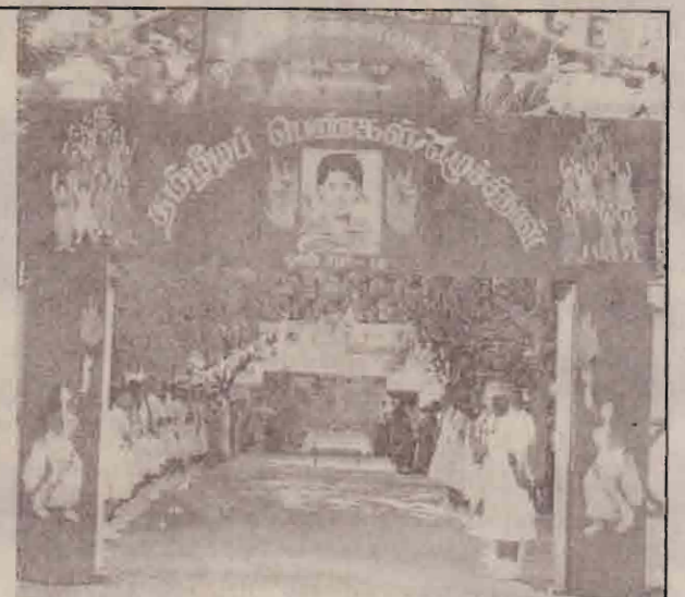
திருகோணமலையில் நடைபெற்ற நிகழ்வு