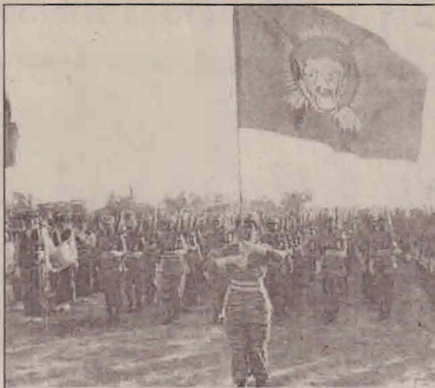
மட்டக்களப்பு மாவட்டத்தில் நடைபெற்ற எழுச்சி நிகழ்வு