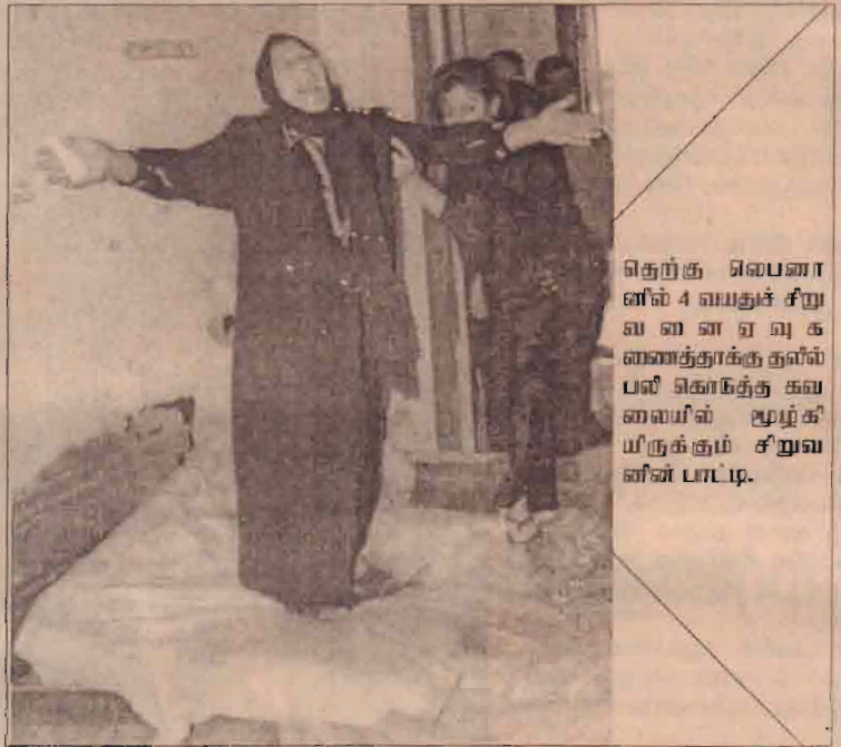
தெற்கு பெணானில் 4 வயதுச் சிறுவனை ஏவுக் கணைத்தாக்குதலில் பலி கொடுத்த கவலையின் பழக்கியிருக்கும் சிறுவனின் பாட்டி.