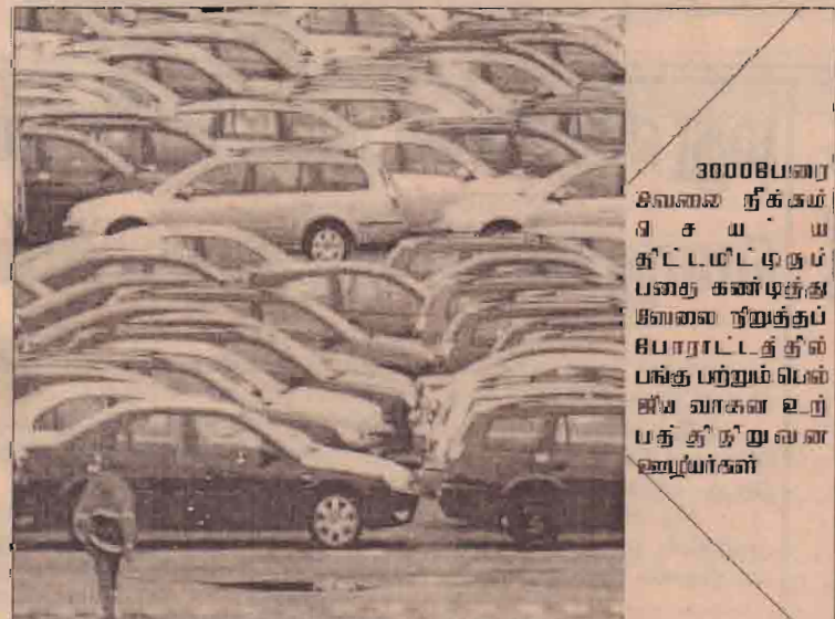
30008பைர சிவனை நீக்கம் செய்ய திட்டமிட்டிருக்கும் படைகளை கண்டித்து சிவனை நிறுத்தப் போராட்டத்தில் பங்குபற்றும் பெண்கள் வாகன உற்பத்தி துறையை அணியர்கள்

பாகிஸ்தானின் அமைதி கொண்டு வருகின்ற போதும், முயற்சிகளை இந்தியா மேற்கொள்ளும் போது இந்தியா மீது பாகிஸ்தான்