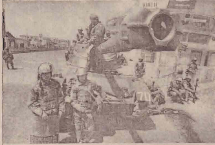
பொலிவியா சனாதிபதிக்கு எதிராக ஆர்ப்பாட்டம் நடந்து வோரை கட்டுப்படுத்த வரவழைக்கப்பட்ட ராணுவத்தினர் தமது கடமையை முடித்து ஒய்வெடுக்கின்றனர்.

நாளுக்கு நாள் போராட்டம் வலுத்து வருகின்றது. இதனால் பொலிவியா முழுவதும் பதற்றம் நிலவுகின்றது.