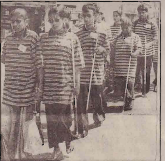
நான் விருட்டிய எதையும் வாங்கிக் கொள்ளவில்லை. விரும்பாத மனச்சுமையை நெஞ்சு

இன்றைக்கு நிதான் முழுவியளம் போலிருக்கிறது. அதையும் சரியாகச் சொல்ல முடியாது. ஏதோ ஒரு பேச்சுக்குத்தான் சொல்கிறேன். புத்தகக் கடையில் ருந்து எரிச்சலோடு இறங்கினேன். காலைத் தவிர காணுக்குள் வைத்துவிட்டேன், நல்ல வேளையாக அது ஆழமாக இருக்கவில்லை. இரண்டு சிராய்ப்புக் காயங்களோடு தப்பிவிட்டேன். இதற்கு மேல் எதுவும் வேண்டாம் என்று அலுத்துக் கொண்டு பேருந்து நிலையத்தை நோக்கி நடந்தேன். ஒரு மோட்டார் சைக்கிள் பழுது பாக்கின்ற கடையில் ஒரே இரைச்சல் போதாக்குறைக்கு ஒரு மின்பிறப் பாக்கியும் சேர்ந்து இந்தக்