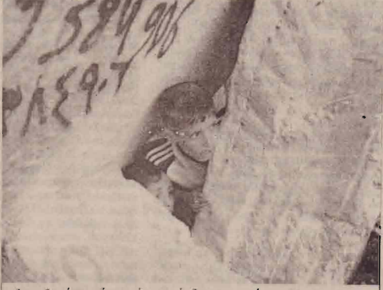
சில தினங்களுக்குமுன் பலஸ்தீன காலாப் பகுதி அகதிமுகாமில் தேடுதல் நடத்திய இஸ்ரேல் ராணுவத்தினரை எட்டிப் பார்க்கும் பலஸ்தீனச் சிறுவன் (தேடுதலின் போது ஆயிரம் பேர் இடம்பெயர்ந்தும் எட்டுப்பேர் உயிரிழந்தும் உள்ளனர்.)