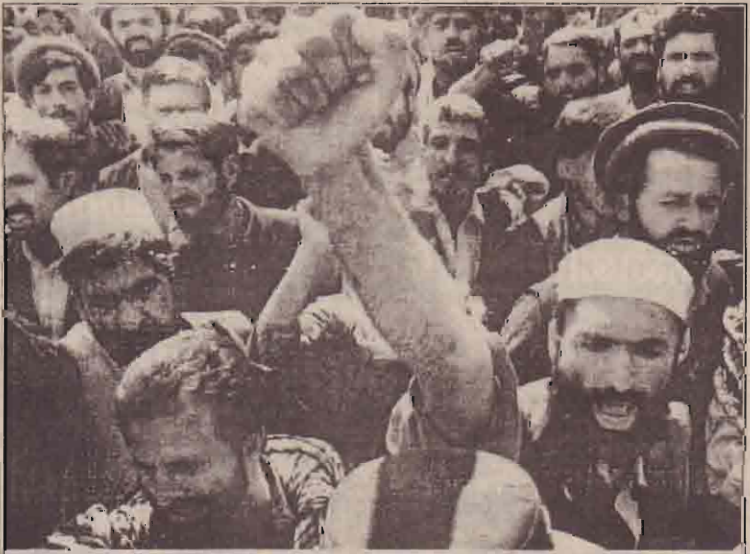
ஆப்கானிஸ்தான் பாதுகாப்பு அமைச்சரின் சீர்திருத்த நடவடிக்கையால் பதவி யிழந்த ஆயிரக்கணக்கான பணியில் சேர்க்குமாறு கோரி சனாதிபதி மாளிகைமுன் ஆர்ப்பாட்டத்தில் ஈடுபட்டுள்ள ஆப்கானிஸ்தானிய பாதுகாப்பு உத்தியோகத்தினர்.

தலிபான் கிளர்ச்சியாளர்களுக்கும், உள்ளூர் படைகளுக்கும்மிடையே கடும் மோதல்கள் நடைபெற்று வருகின்றமை குறிப்பிடத்தக்கது. இதனைக் கட்டுப்படுத்தும் நடவடிக்கையாகவே நேட்டோ படைகளுக்கு அதிக அதிகாரங்கள் கிடைத்துள்ளன.