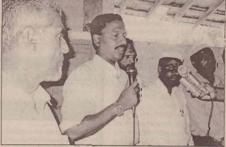
போட்டிகள் நடத்தவும் தடை!

திரு கோணல்வை நெற்செய்கை குறிப்பானது யாழ். நேற்று தமிழீழ விடுதலைப்புலிகள் பிரதிநிதிகளுக்கும் முஸ்லிம் ஊர்ப்பு