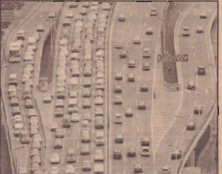
சீனாவின் சங்ஷை நகர உயர்தர வீதி ஒன்றில் பயணிகளும் வாகனங்களும் (கடந்த ஆண்டு சீனாவின் கார் உற்பத்தி 9% வீதத்திலிருந்து 12% வீதத்துக்கு வளர்ச்சியடைந்தது)

அல்-ஹைதா இயக்க அனுதாயிகள் அடைத்து வைக்கப்பட்டிருந்த சிறைக்கூடம் ஒன்றை அந்த நாட்டு அதிகாரிகள் உடைத்து விடுதலை செய்துள்ளனர். கடந்த வருடம் கைது செய்யப்பட்ட பத்து அல்-ஹைதா அனுதாயிகளில் அமெரிக்கர் ஒருவரும் அடங்கியிருந்ததாகத் தம்மை இனங்காண்பிக்க விரும்பாத சவுதி அதிகாரி ஒருவர் தெரிவித்தார். இந்தப் பத்து அல்-ஹைதா அனுதாயிகளும் சவுதி அரேபிய அரசுக்குச் சொந்தமான சவுதி அராம்கோ என்ற எண்ணெய் கம்பனியில் பணியாற்றி வந்தவர்கள் எனத் தெரிவிக்கப்படுகிறது.