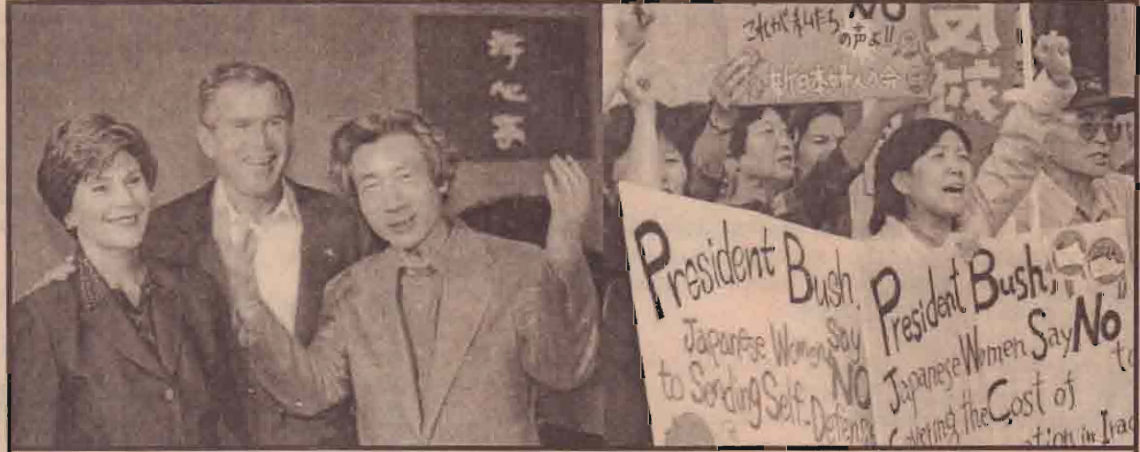
ஆசிய நாடுகளுக்கான விஜயத்தை ஆரம்பித்துள்ள அமெரிக்க சனாதிபதி ஜோர்ஜ் டபிள்யூ புஷ் அவரது பாரியாருடன் முதலில் ஜப்பான் வருகை தருவதையும் மற்றும் டோக்கியோவில் இவரின் வருகைக்கு எதிர்ப்புத் தெரிவித்து ஆர்ப்பாட்டம் நடைபெறுவதையும் படங்களில் காண்க. (தொடர்ந்து பிலிப்பைன்ஸ், தாய்லாந்து, இந்தோனேசியா, சிங்கப்பூர் மற்றும் அவுஸ்திரேலியாவுக்கும் அவர் செல்லவுள்ளார்)