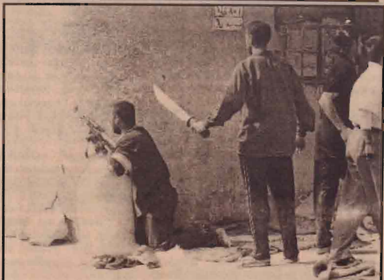
பாக்தாத்துக்கு தெற்கே 110 கி.மீ. தூரத்திலுள்ள கர் பாலாவில் ஈராக் போராளிகளுக்கும், அமெரிக்கப் படையினருக்குமிடையில் நடைபெறும் துப்பாக்கிச் சமரின் போது நிலை எடுக்கும் ஈராக்கிய போராளிகள்.

சனாதிபதி லொசாடா (வயது-73) பதவியை விட்டு விலகுவதாக அறிவித்துள்ளார். சனாதிபதியின் இந்த முடிவினால் ஆர்ப்பாட்டக்காரர்கள் வீதிகளில் இறங்கி மகிழ்ச்சி ஆரவாரத்தில் ஈடுபட்டுள்ளனர்.