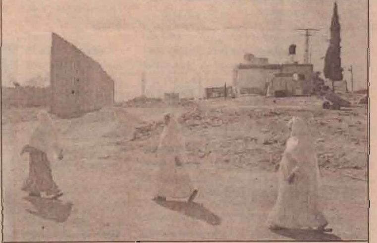
பலஸ்தீன மேற்குக்கரை முஷா கிராமத்திற்கு அண்மையில் இஸ்ரேலியப் படையினரால் புதிதாக அமைக்கப்பட்ட எல்லைச் சுவருக்கருகில் நடந்து செல்லும் பலஸ்தீனப் பெண்கள்.

பாதுகாப்பு வேலி அமைக்கப்படுவது குறித்து இஸ்ரேலியப் பிரதமரிடம் தொலைக்காட்சி பேட்டி ஒன்றின்போது செய்தியாளர் கேட்ட கேள்விக்குப் பதிலளிக்கையில் பாதுகாப்பு வேலி அமைக்கப்படுவதை அவர் உறுதிப்படுத்தினார்.