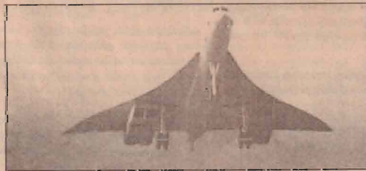
தலைசிறந்த கொண்கோர்ட் கப்பலொன்றில் ரக விமானங்களில் ஒன்று லண்டனில் விமானப்படைக்குட்பட்ட ஒன்றிலிருந்து எழும்பிச் செல்கின்றது. இது பிரிட்டன் விமானப்படையின் 30 வருட பாவனையின் பின் நிறுத்தப் படுகிறது.

னைகளுக்கு பிரிட்டன் உதவ வேண்டும் எனவும் கேட்டுக் கொண்டார். கறுப்பினத்தவர்களின் பிரச்சினைக்கு தீர்வுகாண இதுவரை என்ன நடவடிக்கை எடுக்கப்பட்டுள்ளது. என்பதை சீர்தூக்கிப் பார்த்து எதிர்க்காலத்தில் முகம் கொடுக்க வள்ள சவால்களை எவ்வாறு தீர்க்கலாம் என்பது குறித்து ஆலோசிக்க வேண்டும் எனவும் அவர் குறிப்பிட்டுள்ளார்.