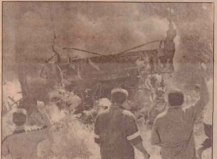
ஈராக்கில் குண்டுத் தாக்குதலில் சேதமடைந்த அமெரிக்க இராணுவ வாகனமொன்றை தீயீட்டுக் கொழுத்தி மசூமும் ஈராக்கியர்கள்.

இதேபோன்று எல்-16, எல்-16பி போன்ற விமானங்களைப் பயன்படுத்தி பாகிஸ்தான் தனது அணுவாயுதங்களைப் பயன்படுத்த திட்டமிட்டுள்ளதாகவும் இந்த அறிக்கை மேலும் கூறியுள்ளது.