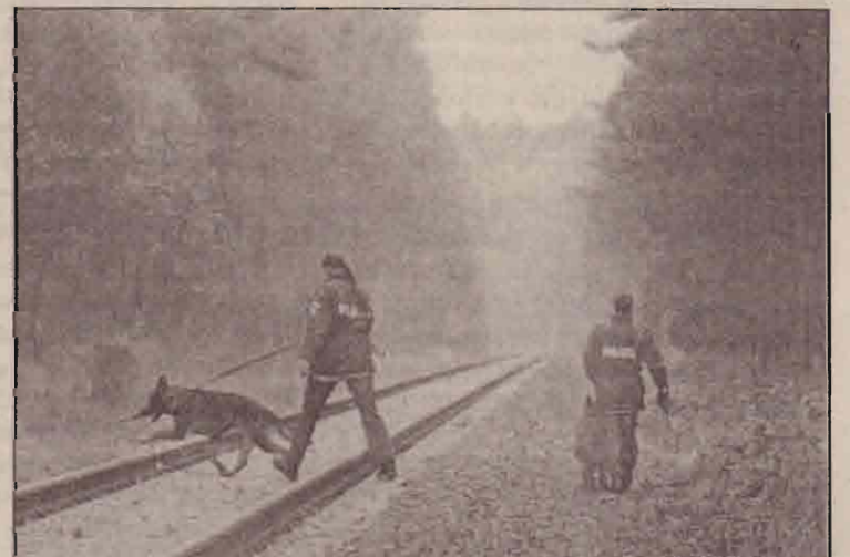
ஜெர்மனியிலிருந்து பிரான்சுக்கு அணுசக்தி கழிவுகளைக் கொண்டு செல்வதை தடுக்கப்போவதாக ஆயிரக்கணக்கான ஜெர்மனியர்கள் ஆர்ப்பாட்டம் செய்வதை அறிந்த பொலிசார் நாய்களுடன் கெடெலிஸ் கிப்பிளின்...

சவுதி அரேபியத் தாக்குதல் தீவிரவாதிகளின் இலக்கற்ற தாக்குதல் என்பதுடன் இது ஒரு முறையற்ற தாக்குதல் எனவும் சவுதி அரேபியாவின் பிரிட்டன் தூதரவர் கூறியுள்ளார்.