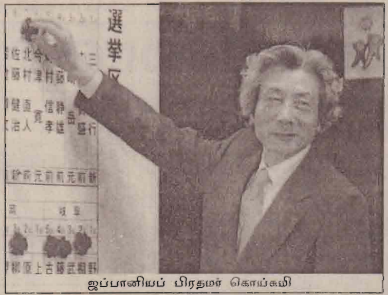
ஐப்பானியப் பிரதமர் கொய்சுமி

எதிர்க்கட்சிகள் அதிக இடங்களைப் பெற்றிருப்பதால் பிரதமர் சீர்திருத்தங்களை நடைமுறைப்படுத்துவதில் சிக்கல்களை எதிர்நோக்கக் கூடும் என்று எதிர்பார்க்கப்படுகின்றது.