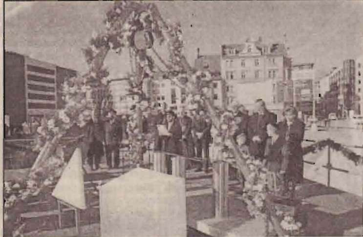
தெற்கு ஜேர்மனி யியூனிச் நகரில் புதிய யூத மத்திய நிலையத்திற்கான அடிக்கல் நாட்டு விழாவில் கலந்துகொள்ளும் மதத் தலைவர்களும், அரசியல் வாதிகளும்.

இவர்களின் எதிர்காலம் பற்றி இந்நேசியாவில் முடிவு செய்யப்படும் என அவுஸ்திரேலிய குடிவரவுத் திணைக்கள அமைச்சர் கூறியுள்ளார்.