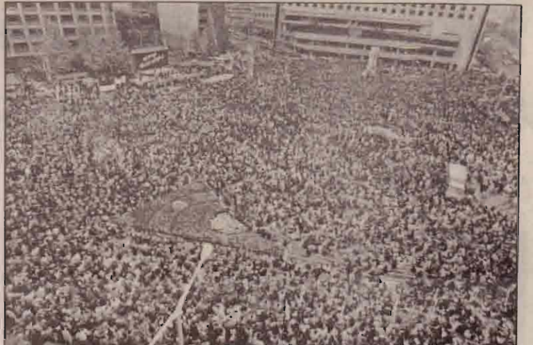
தொழிற்சங்க வாதிகளின் சம்பளத்தை அபகரித்ததற்காகவும் வேலை நிறுத்தத்தில் ஈடுபட்டோருக்கு மீண்டும் வேலை வழங்கக் கோரியும் தென் கொரிய சியோல் நகரில் ஆர்ப்பாட்டம் செய்யும் ஊழியர்கள்.

சரானில் நேற்று முன்தினம் பேருந்து விபத்தொன்றில் 34 பேர் உயிரிழந்துள்ளனர். 10 பேர் காயமடைந்துள்ளனர். மத்திய சரானிலேயே இந்த விபத்து ஏற்பட்டுள்ளது. பயணிகள் பேருந்தும், நக் ஒன்றும் மோதிக் கொண்டமையினாலேயே இந்த விபத்து ஏற்பட்டது. உலகில் அதிகமான விதிவிலக்குகள் ஏற்படும் நாடுகளில் சரானும் ஒன்று என்பது குறிப்பிடக்கூடிய