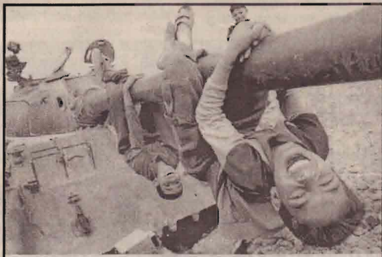
முன்னாள் குடியரசுத் தலைவரின் வளாகத்தில் கைவிடப்பட்ட அமெரிக்க T-72 ரக டாங்கி மீது ஏறிவிளையாடும் சுராக்கிய சிறுவர்கள்.

ஆயுதப் போராட்டத்தினைத் தொடர்ந்து 15லட்சம்பேர் தமது வீடுகளை விட்டு வெளியேறியுள்ளனர். அவர்களில் பலர் வீடு திரும்பியிருந்ததால் சுமார் 2 லட்சம்பேர் உள்நாட்டில் அகதிகளாக உள்ளமை குறிப்பிடத்தக்கது. அத்துடன் புலம்பெயர்ந்த 40ஆயிரம் பேர் வீதித்தடைகள் காரணமாக தாயகம் திரும்பாமல் உள்ளனர்.