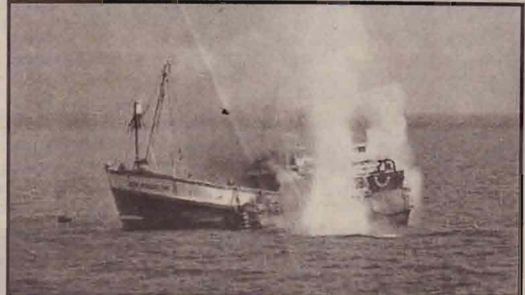
தாய்லாந்து நாட்டு சட்டவிரோத மீன்பிடிப் படகொன்றை மூழ்கடிக்கும் இத்தோனேசிய கடற்படைக் கப்பல். இரண்டுநாட்களுக்கு முன்பு அங்கு ரோந்து நடவடிக்கை ஆரம்பமானது. (சம்பவத்தில் 18 தாய்லாந்து மீனவர்கள் கைது செய்யப்பட்டனர்.)

தனது பணிகளைச் செய்வதற்கு அரசாங்கம் போதியளவு நிதியை தராமையால் தான் பதவியில் இருந்து விலகப் போவதாக அறிவித்துள்ளார்.