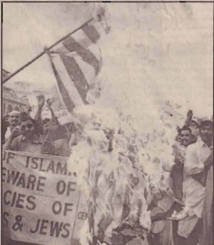
அமெரிக்கப் படைகள் சுராக்கிய பொது மக்களைப் படுகொலை செய்வதைக் கண்டித்து பாகிஸ்தான் கனிமுஸ்லிம்கள் அமெரிக்க தேசியக் கொடியினை எரிக்கின்றனர்.