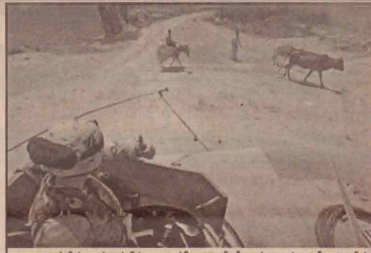
ஈராக்கில் பாக்தாத்திற்கு வடக்கே 57 கி.மீ அப்பாலுள்ள பகோலாவில் அமெரிக்க மூன்றாவது படைப்பிரிவைச் சேர்ந்த இராணுவத்தினர் ஒருவர் ஈராக்கியச் சிறுவர்களுக்கு பெருவிரல் உயர்த்திக் காட்டுகிறார்.

என்றும் அமெரிக்க ஆசை காட்டியதாகவும் இதைத் தீவிரவாதிகள் ஏற்றுக் கொள்ளவில்லை எனவும் தெரிவிக்கப்படுகிறது. ஈராக்கில் தீவிரவாதிகள் தாக்குதலில் இது வரை 1200 அமெரிக்க வீரர்கள் பலியாகியுள்ளமை குறிப்பிடத்தக்கது.