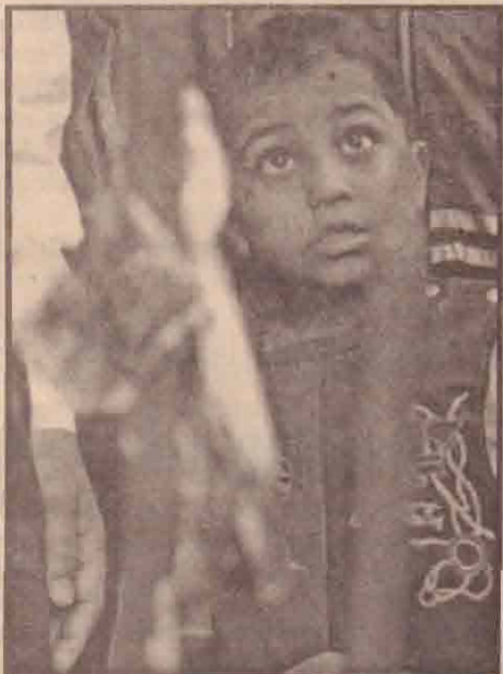
எகிப்தில் குண்டு வெடிப்பு நடைபெற்ற இடத்தில் வேலியில் படிந்த இரத்தக் கறைவைச் சிறுவன் ஒருவன் அவதானிக்கின்றான்..

இது சதாம் உசேன் பயன்படுத்திய வேட்டை என்று தெரிய வந்துள்ளது. போர்க் குற்றம் புரிந்த கைதியாக இருக்கும் சதாம் உசேனின் கணக்கில் இந்த படு கொலைகளும் சேர்க்கப்பட்டு விசாரணை நடக்கும் என தெரிவிக்கப்படுகிறது.