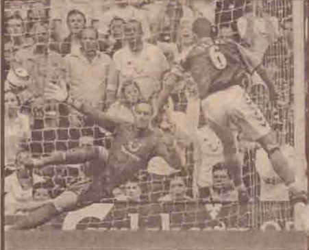
இங்கிலாந்து ரொட்ரென் காம் அணிக்கும் அஸ்டன் வில்லா அணிக்கும் இடையில் நேற்று நடைபெற்ற காஸ்பந்து போட்டியில் வெற்றியைக் கொண்டாடும் அஸ்டன்வில்லா வீரர்களையும், ரொட்ரென்காம் வீரர் கோல் ஒன்றை அடிப்பதையும் பட்டியலில் காணலாம்.