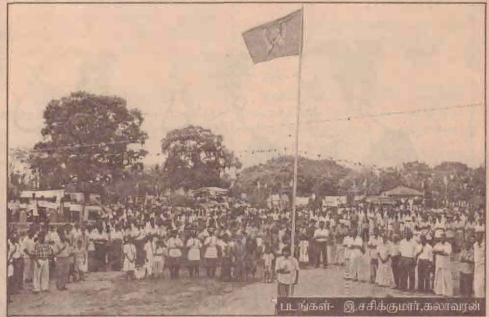
படங்கள்- இ.சசிக்குமார், கலாவரன்