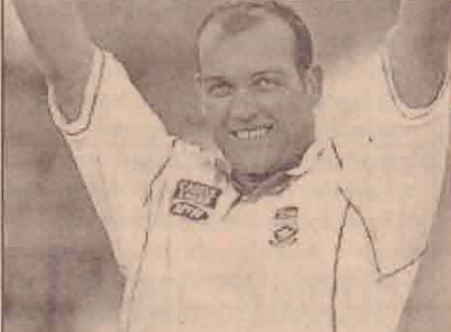
சதமடித்து ஹட்டிக் சத சாதனையையும் ஏற்படுத்தினார்.

மேற்கிந்தியத்தீவுகள், தென்னாபிரிக்க அணிகளுக்கிடையிலான அன்டிக்குவா டெஸ்ட் போட்டியின் இரண்டாம் நாள் ஆட்ட முடிவில் மேற்கிந்தியத்தீவுகள் அணிக்கெதிராக மேலும் இரு வீரர்கள் பெற்ற சதங்களுடன் தென்னாபிரிக்கா நான்கு விக்கெட் இழப்பிற்கு 525 ஓட்டங்களைப் பெற்றுள்ளது. முதல் நாள் எண்ணிக்கையான 214 ஓட்டங்களுடன் ஆட்டத்தை ஆரம்பித்த தென்னாபிரிக்கா 245 ஓட்டங்களைப் பெற்றநிலையில் வில்லியர்ஸினதும், ஸ்மித்தினதும் விக்கெட்டுக்களை இழந்தது. பின்னர் களமிறங்கிய டிப்பென்னர் ஐந்து ஓட்டங்களுடன் ரன் அவுட் முறையில் ஆட்டமிழந்தார். அடுத்ததாக கிப்ஸ் 23 ஓட்டங்களைப் பெற்ற நிலையில் பெஸ்ட்டின் பந்து வீச்சில் டியோ நரைனிடம் பிடிகொடுத்து ஆட்டமிழந்தார். அடுத்து வந்த கலிஸ், பிரின்ஸ் இருவரும் மேற்கிந்தியத்தீவு வீரர்களின் பந்துகளை துவம்சம் செய்து முறையே 127, 114 ஓட்டங்களைப் பெற்று ஆட்டமிழக்காது இருந்தனர். கலிஸ் 127 ஓட்டங்களைப் பெற்று முன்னாள் வீரரான கோரி கர்ஸ்டனின் சதச் சாதனையை முறியடித்துள்ளார். அத்துடன் மூன்று போட்டிகளில் தொடர்ந்து