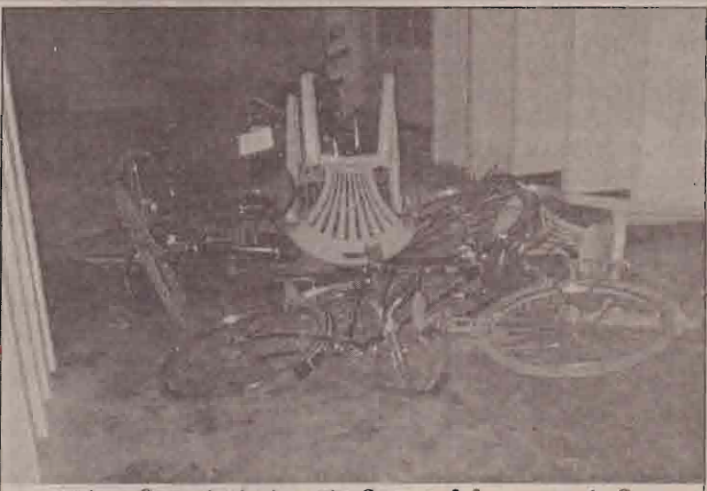
அடித்து நொருக்கப்பட்ட சர்வதேச தமிழீழ மாணவர் பேரவை அலுவலகம். (படம் : ஆன்சிலீன்)