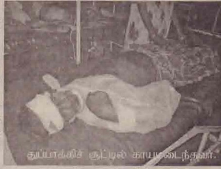
துப்பாக்கிச் சூட்டில் காயமடைந்தவர்.

யாழ்ப்பாணம் புங்குடுதீவில் வைத்து யுவதி ஒருவர் சிறிலங்கா கடற்படையினரால் பாலியல் வல்லுறவுக்குள்ளாக்கப்பட்டு படுகொலை செய்யப்பட்டதைக் கண்டித்து அப்பகுதி மக்கள் நேற்று போராட்டத்தில் ஈடுபட்டனர். போராட்டத்தில் ஈடுபட்ட மக்களை கடற்படையினர் கடுமையாகத் தாக்கியதன் துப்பாக்கிப் பிரயோகமும் செய்துள்ளனர். இதில் ஒருவர் படுகாயமடைந்துள்ளார். குறித்த யுவதி படுகொலை செய்யப்பட்ட இடத்திற்கு அண்மையில் உள்ள கடற்படை முகாமிற்கு முன்னால் மக்கள் நேற்றுக் காலை முதல் ஆர்ப்பாட்டத்தில் ஈடுபட்டனர். வீதிகளை மறித்து ரயர்களைப் போட்டு எரித்து மறியலில் ஈடுபட்டனர். இதன் போது கடற்படையினர் மேற்கொண்ட துப்பாக்கிச்சூட்டில் (12ஆம் பக்கம் பார்க்க)