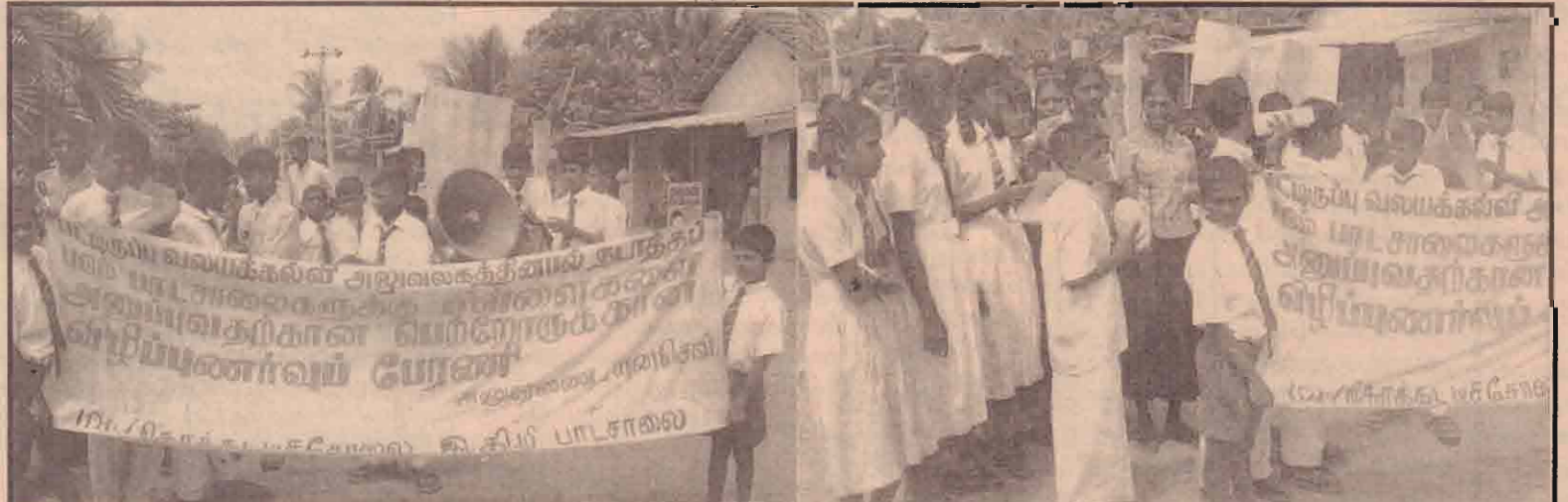
புதிதென நிறுவனத்தின் அலுவலகத்தில் மட்டக்களப்பு கல்வி வளத்துறையில் நேற்று கொக்கட்டிச்சேவை நடத்தப்பட்ட சில விவசாய மாணவர்களை பாடசாலைக்கு அனுப்புவதற்கான வழிமுறைகளை அறிவிப்பதற்குப் பேரணி கலந்து கொண்டிருக்கிறார்கள். தி.கி.வி. பாடசாலை மாணவர்களைப் பற்றிய கலந்துரையில் கலந்து கொண்டிருக்கிறார்கள். (மேலும், கலந்துரையில் அ.புலாஜ்)

தோட்டத்தில் வேலை செய்வதன் பின்னை பராமரிப்பதிலும் பெண்கள் ஈடுபடுவதால் பெண்கள் கூட்டங்கள் போன்றவற்றில் கலந்துகொள்வதில்லை, கலாசார கட்டுப்பாடு காரணமாக பொது விடயங்களிலும் பெண்கள் ஈடுபடுவதில்லை என்றார்.