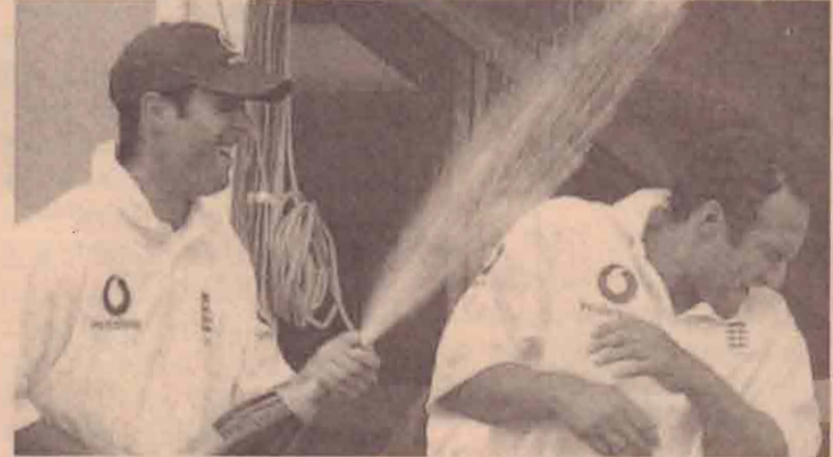
இங்கிலாந்து அணி தொடரை வென்றது. இங்கிலாந்து, நியூசிலாந்து

பெற்ற கடைசி நாள் ஆட்டத்தின் போது வெற்றி பெற 45 ஓட்டங்கள்