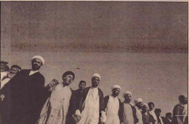
மத்திய பாக்கத்தலில் சியா மதத்தலைவர்-அலிஅல்சின் டானியின் ஆதரவாளர்களால் நடத்தப்பட்ட எதிர்ப்பு ஊர்வலம்.