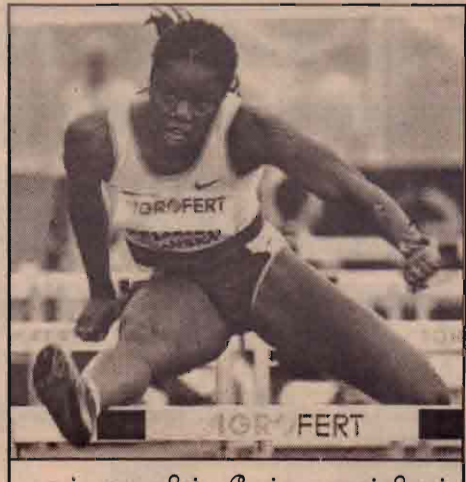
ஓட்டாவாவில் நேற்று முன்தினம் நடைபெற்ற பெண்களுக்கான கிரான்ட் பிரிக்ஸ் தங்கப் பதக்கத்துக்கான தடை தாண்டல் 100 மீற்றர் ஓட்டப் போட்டியில் பங்கேற்கும் கனடாவின் பெரிட்டா மெலிசியா.