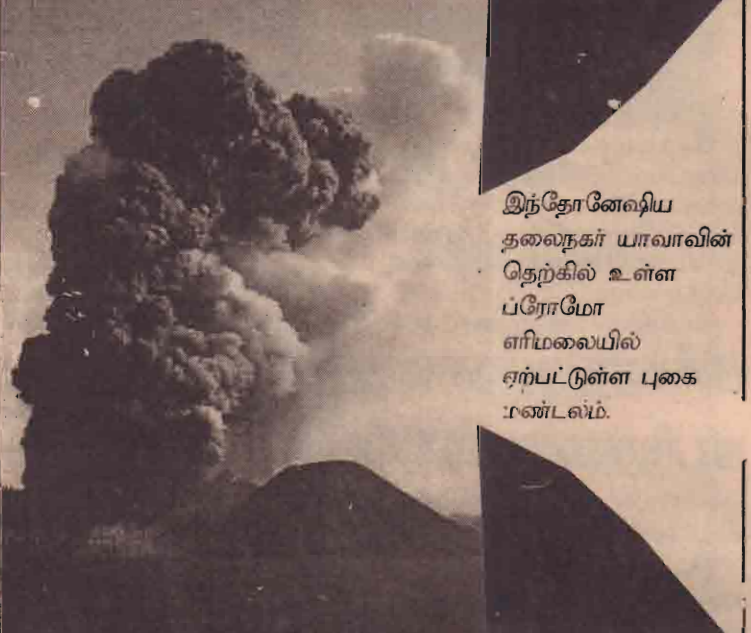
இந்தோனேஷிய தலைநகர் யாவாவின் தெற்கில் உள்ள ப்ரோமோ எரிமலையில் ஏற்பட்டுள்ள புகை மண்டலம்.