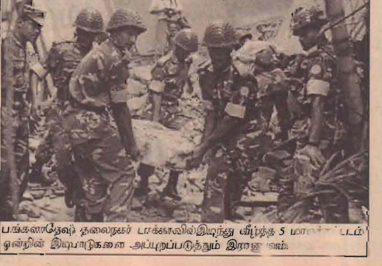
பங்களாதேஷ் தலைநகர் டாக்காவில் இடிந்து விழ்ந்த 5 மாடிக் கூட்டம் ஒன்றின் இடிபாடுகளை அடையுறப்படுத்தும் இராணுவம்.

சவுதி அரேபியாவில் அமெரிக்கர் ஒருவர் அடையாளம் தெரியாத நபர்களால் நேற்று முன்தினம் சுட்டுக்கொல்லப்பட்டுள்ளார். சுட்டுக்கொல்லப்பட்ட அமெரிக்கர் றியாத் நகரிலுள்ள எண்ணெய் நிறுவனத்தில் பணியாற்றி வந்தவராவார் அவரது கொலையைப்பற்றி சவுதியில் பெரும்பரப்பு ஏற்பட்டுள்ளது. அமெரிக்காவின் தீவிரவாத ஒழிப்பிற்கு சவுதியும் ஆதரவு தெரிவித்துள்ளது. இதனையடுத்து அல்ஹதா தீவிரவாதிகள் அடிக்கடி சவுதியில் தாக்குதல்களை அதிகரித்திருந்தனர். இதனால் நேற்று முன்தினம் அமெரிக்கர் சுட்டுக்கொல்லப்பட்டதற்கு அல்ஹதாவே காரணமாக இருக்க வேண்டும் என்றும் கூறப்படுகின்றது. அமெரிக்கர்களுக்கு எதிராக சவுதியில் நடைபெறும் ஐந்தாவது தாக்குதல் இதுவாகும் என்பதும் குறிப்பிடத்தக்கது. இதனால் சவுதியில் பணிபுரியும் வெளிநாட்டவர்களிடையே அச்சம் தற்பட்டுள்ளது.