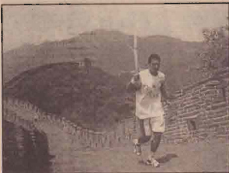
கனாவுக்கு எடுத்து வரப்பட்ட ஒலிம்பிக் ஜோதி நேற்று சீனப் பெருஞ்சுவர் வழியாக வீரர் ஒருவரால் ஏந்திச் செல்லப்படும் காட்சி.