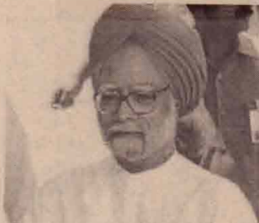
மாநிலங்களவைத் தலைவர் மாநிலங்களவையை ஒத்திணைத்துள்ளார்.

யினரின் பலத்த எதிர்ப்பு நடவடிக்கையினால் ஒத்திணைக்கப்பட்டுள்ளது. நேற்று ஆரம்பமான மக்களவையின் கூட்டத் தொடரில் ஊழல் மற்றும் மோசடி பற்றி தேசிய சனநாயகக் கூட்டணி விமர்சனம் செய்ததுடன், அதில் சம்பந்தப்பட்டவர்கள் மத்தியமைச்சரவையில் இருக்கக் கூடாது என்பதற்குப் பிரதமர் உடனடியாகப் பதிலளிக்கும் வேண்டும் என்று கூச்சலிட்டுள்ளனர். பின்னர் வெளிநடப்பு செய்துள்ளனர் இதனால் மக்களவை ஒத்திணைக்கப்பட்டுள்ளது. இதேபோல் மாநிலங்களவையும் நேற்று ஆரம்பமானது தேசிய சனநாயகக் கூட்டணியினர் எதிர்ப்புத் தொரிவித்தனர். பதிலாக குகாங்கிரசும் எதிர்ப்புக் காட்டியதில் அமளி ஏற்பட்டது. இதனையடுத்து