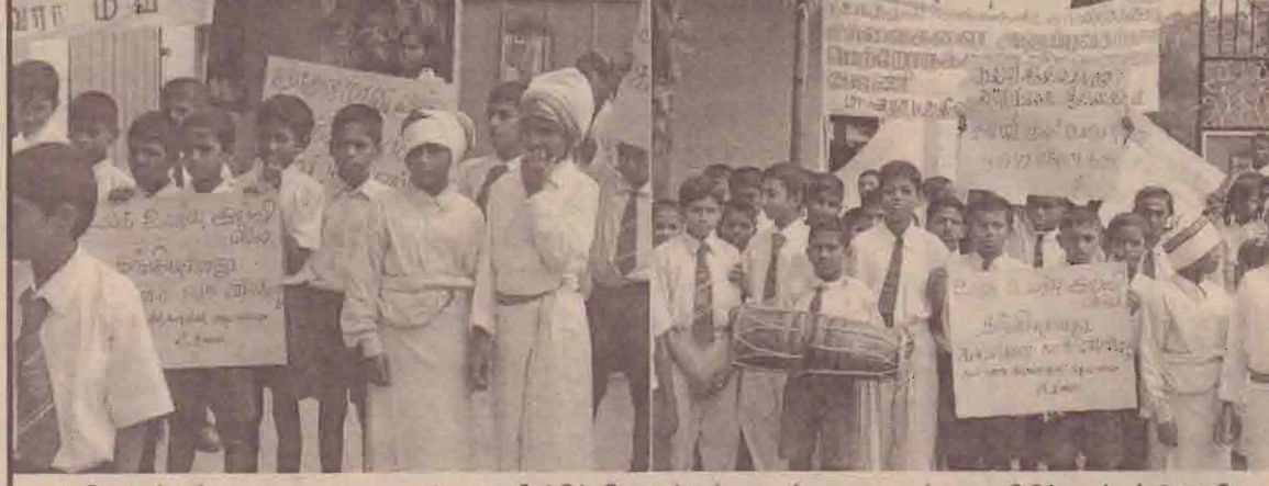
கிடைவில்லா பாடசாலை மாணவர்களை மீண்டும் இணைத்துக் கொள்வது தொடர்பான விழிப்புணர்வுப் பேரணி சரசுபத்தீவில் நடைபெற்றது. கீழ்தம், பீரவியில் கலந்துகொண்ட மாணவர்களையும் விழிப்புட்டல், திகுவுகளையும் மத்தில் காணலாம். (மும். கி. வாதராஜன்)

(எஸ்.சிவராசா) தகவல் தொழில் நுட்பப் பாடத்தை பாடசாலைகளில் அரசு அமுல்படுத்தி வருகிறது. இதன் மூலம் எதிர்கால சந்ததியினரான மாணவர்களுக்கு தகவல் தொழில் நுட்பம் பற்றிய அறிவை வளர்க்க முடியும் என எதிர்பார்க்கப்படுகிறது. இத்திட்டத்திற்கு முதலில் ஆசிரியர்களை பயிற்றுவித்தல் வேண்டும். இதற்காக தெரிவு செய்யப்பட்ட பாடசாலைகளில் இருந்து மூன்று ஆசிரியர்கள் வீதம் தெரிவு செய்யப்பட்டு இவர்களுக்கான பயிற்சிக் கல்முனையிலும் இரண்டாவது பயிற்சிகள் தெறுயத்த கண்டியிலும் தற்போது இடம் பெற்று வருகின்றது. இவ்வாறு பயிற்சியை முடித்துக் கொண்டவர்கள் தாம் பாடசாலைகளில் மேற்கொள்ளும் கணனிப் பணிகளை மேற்காள்வையிடுவதற்காக அதிகாரிகள் ஓகஸ்ட் மாதம் முதல் வாரத்தில் பாடசாலைக்கு ள்றுபுத்தாக அவர்கள் தேர்வித்துள்ளார்கள்.