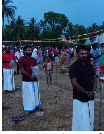
மட்டக்களப்பு - பன்குடாவெளி