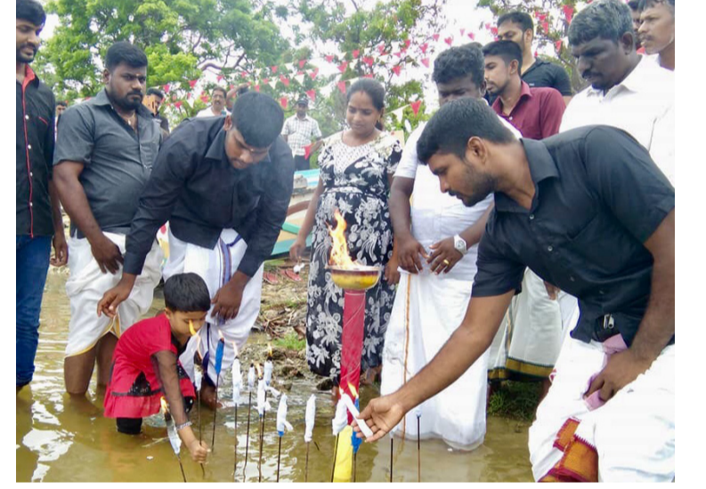
மட்டக்களப்பு - வாகரை