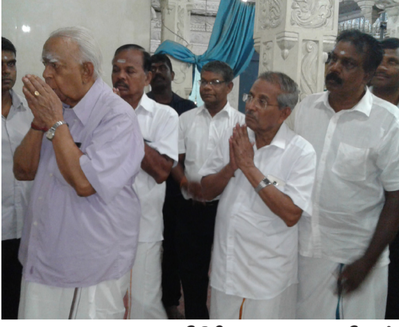
திருகோணமலை - சிவன் கோயில்