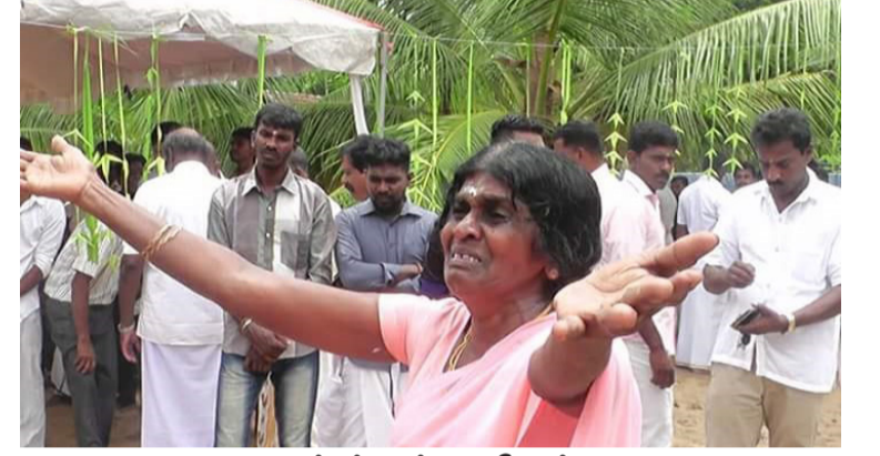
மட்டக்களப்பு - கிரான்