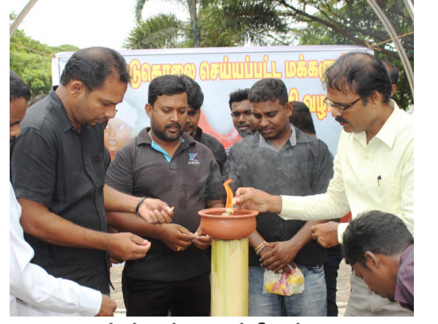
மட்டக்களப்பு - காந்தி பூங்கா