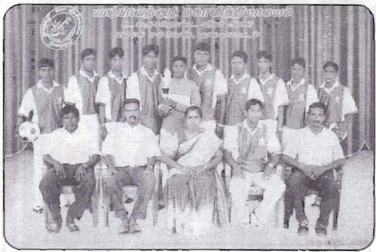
உதைபந்தாட்ட வீரர் அணி 2006 சம்பியன், வலயமட்டம்.