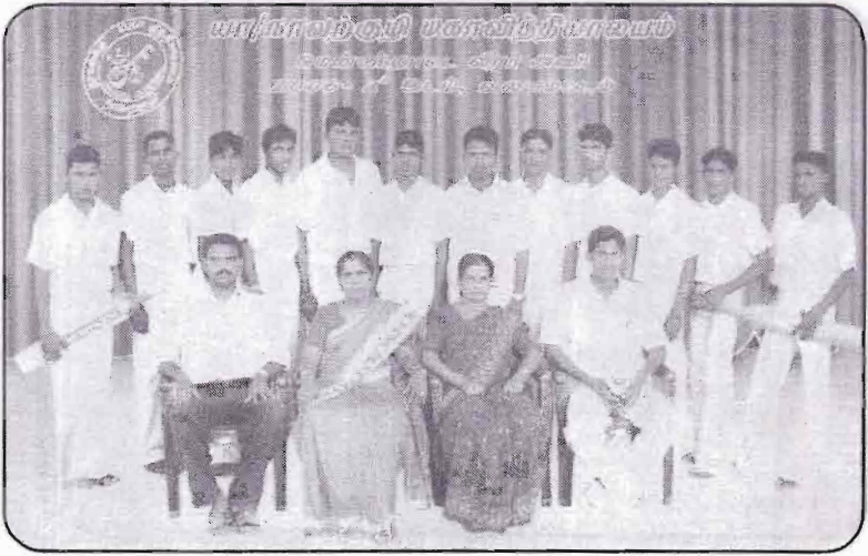
மென்பந்தாட்ட வீரர் அணி 2006 - 20 ம் இடம், வரயமட்டம்