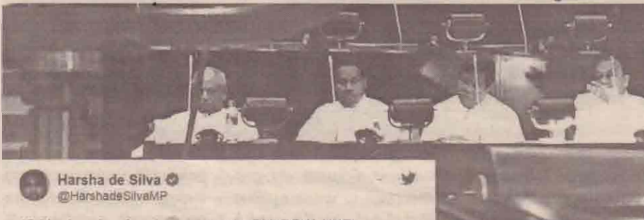
Harsha de Silva @HarshadeSilvaMP JO bigwigs glum faced #SriLanka PM @RW_UNP #NoConfidenceMotion debate just begun. @officialunp will defeat motion. 9:59 AM - Apr 4, 2018 143 75 people are talking about this

கூட்டு எதிர்க்கட்சியின் சிரேஷ்ட உறுப்பினர்களின் முகம் சோகமடைந்து காணப்பட்டதாகத் தெரிவிக்கப்படுகிறது. அவர்களின் சோகத்தை வெளிப்படுத்தும் வகையில், இராஜாங்க அமைச்சர் ஹர்ஷ டி சில்வா டூவிட்டரில் பதிவு ஒன்றை வெளியிட்டுள்ளார். தனது டூவிட்டர் பக்கத்தில் இது தொடர்பில் புகைப்படம் ஒன்றை பதிவிட்டு, நம்பிக்கையில்லாப் பிரேரணை ஐக்கிய தேசிய கட்சியினால் தோல்வியடையச் செய்யப்படும் எனக் குறிப்பிட்டுள்ளார். (இ-7)