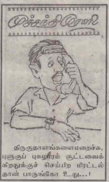
திருகுதாளங்களை மறைச்சு, புதுகுப் புகழாரம் சூட்டவைக்கறதுக்குச் செய்யிற மிட்டல் தான் பாருங்கோ உது...!

தனங்காப்பு, அறுகுவேளிப் பகுதிகளில் நேற்றுக்காலை 8.30 மணி யளவில் கிபிர் விமானத்திலிருந்து குண்டு வீச்சுத் தாக்குதல் நடத்தப்பட்டது. (உ-15-30-139)