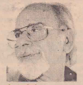
பணிகள் பெரிதும் பாராட்டப்பட வேண்டும். இலங்கை, இந்தியா ஆகிய இரு நாடுகளுக்கும் இடை (14 ஆம் பக்கம் பார்க்க)

அரசியல் பிரமுகங்களையும் நாடாளுமன்ற உறுப்பினர்களையும் சந்தித்துப் பேச்சு நடத்துவார் என்று தெரிவிக்கப்பட்டது. நேற்று கொழும்பு வந்து சேர்ந்த குஜரால் செய்தியாளர் சந்திப்பு ஒன்றில் கலந்து கொண்டார். இலங்கை இனப்பிரச்சினைக்குத் தீர்வு காணும் விடயத்தில் மூன்றாம் தரப்புகளின் தலையீடு தேவையில்லை என்று அவர் செய்தியாளர் மாநாட்டில் கூறியதாக ரூபாவாஹினி தெரிவித்தது. 'சாக்' அமைப்பின் ஓர் உறுப்பினராக இருந்து இலங்கை ஆற்றும்