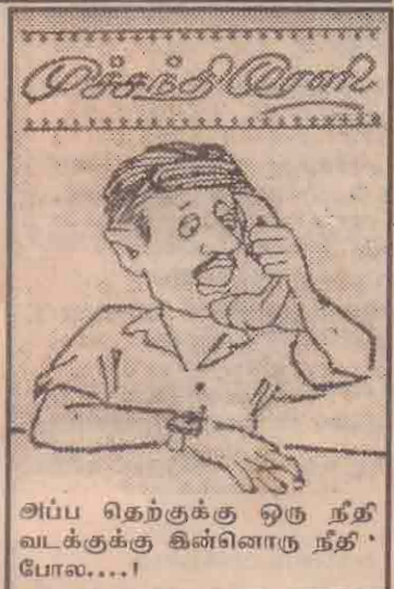
அப்ப தெற்குக்கு ஒரு நீதி வடக்குக்கு கின்னொரு நீதி போல....!

குண்டுகளை வெடிக்க வைத்து நால்வர் உயிரை மாய்த்தனர் கொழும்பு, மார்ச் 12 கொழும்பு நகரை அண்டிய இராஜகிரிய காஸில் வீதியில் நேற்றுமுன்தினம் மாலை தாக்குதல் நடத்தி வீட்டுத் தப்பிச் சென்றவர்களில் ஐவர் உயிரிழந்துள்ளனர். பொருளை வீதியில் அடைந்துள்ள 'செப்பென்னை' அரச தொடர்மாதிக் கட்டத்தினுள் மறைந்திருந்த அவர்களில் ஒருவர் படையினரால் சுடப்பட்டு இறந்துள்ளதாகவும் ஏனைய நால்வரும் தமது உடலில் பொருத்தப்பட்டிருந்த குண்டுகளை வெடிக்க வைத்து உயிரை மாய்த்துக்கொண்டதாகவும் தெரிவிக்கப்படுகின்றது. தாக்குதல் நடத்திவிட்டு இந்த ஐவரும் பொருளை பக்கமாகச் செல்லும் ரயில் தண்டாளம் வழியே வேட்டுக்களைத் தீர்த்துச் சென்றனர். பின்னர் அவர்கள் 'செப்பென்னை' தொடர்மாதிக் கட்டத்தினுள் நுழைந்து அந்தக் கட்டத்தின் நான்காம் மாடியில் மறைந்திருந்தனர். கட்டத்தினுள் நுழைவதற்கு (12ஆம் பக்கம் பார்க்க)