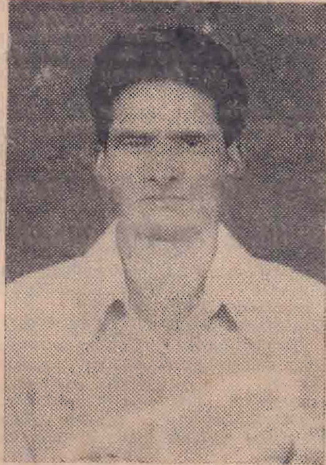
"பாழ்வு தந்த தெய்வம் வாயம் சென்றதேனோ"