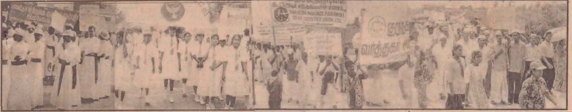
நேற்றைய சமாதானப் பேரணியில் கலந்துகொண்ட மதகுருமார்கள் பாடசாலை மாணவர்கள் பொது அமைப்புகளின் பிரதிநிதிகளை படங்களில் காணலாம்.

சுடர்:15 வள்ளுவர் ஆண்டு 2031 பங்குனி 13 நாயிற்றுக்கிழமை (26-03-2000) UTHAYAN - A Lively National Tamil Daily கதர்:103