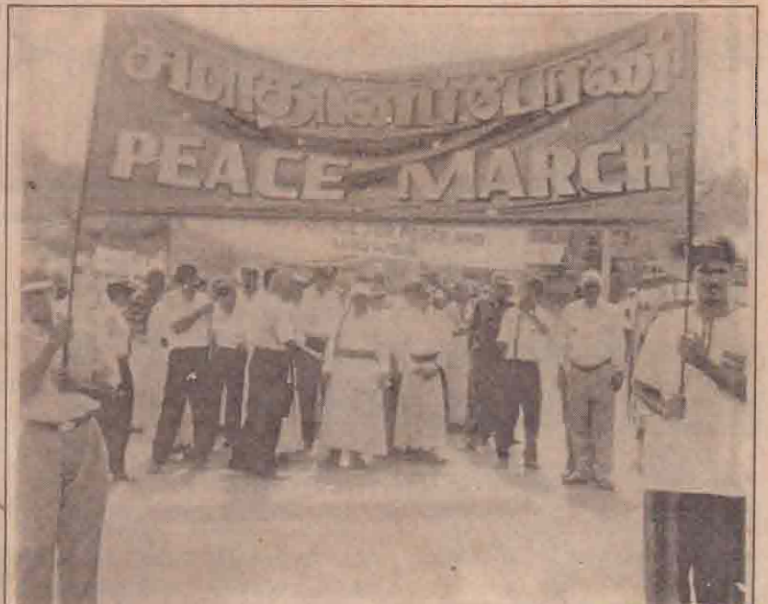
உள்வலத்தின் ஆரம்பத்தில் 'சமாதானப் பேரணி' என்னும் பதாகையுடன் பேரணியினர் புறப்பட்டு வரும் காட்சி.