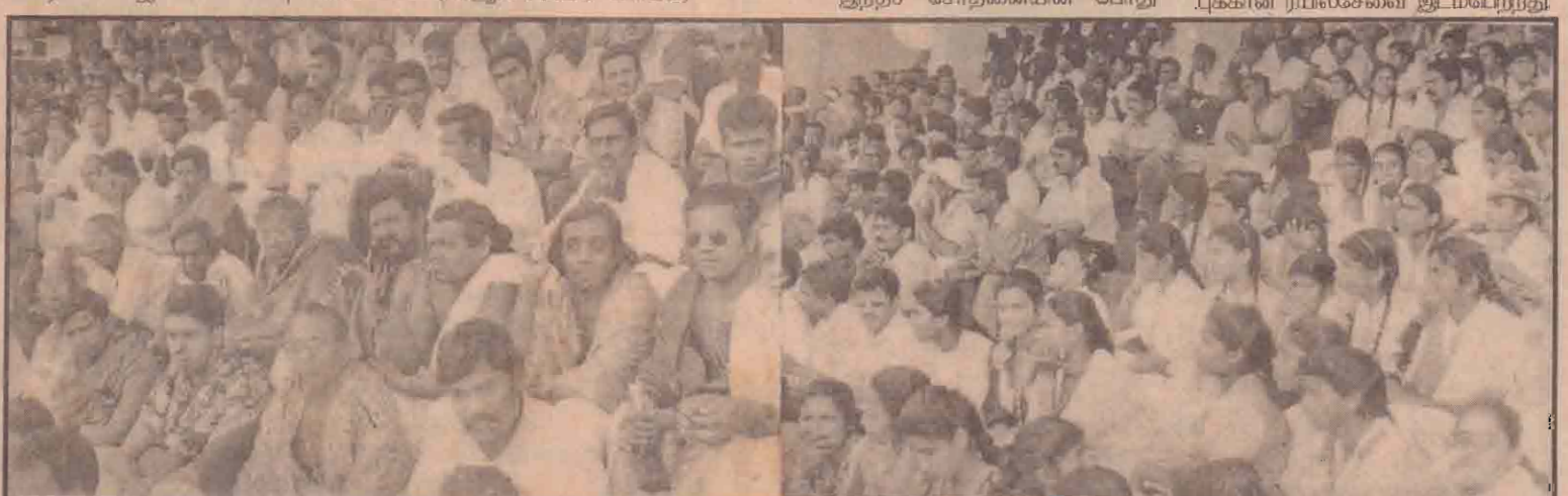
பேரணியின் இறுதியில் யாழ். துரையப்பர் விளையாட்டரங்கில் இடம்பெற்ற நிகழ்வில் கலந்துகொண்டோரில் மேலும் ஒரு பகுதியினர்.

இதனைத் தொடர்ந்து பயணிகள் அனைவரும் இறக்கப்பட்டு அந்தக் குண்டு பாதுகாப்பாக மீட்கப்பட்டு வெளியே கொண்டு வரப்பட்டு வெடிக்க வைக்கப்பட்டது. ரயில் பெட்டியில் கிடந்த வெடிகுண்டினால் நேற்றிரவு ஒரு மணித்தியாலதாமத்தின் பின்னரே கொழும்புக்கான ரயில்சேவை இடம்பெற்றது.