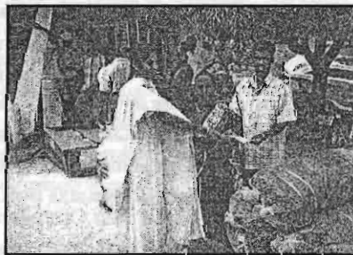
கணவனை இழந்த கனாமியால் பாதிக்கப்பட்ட பெண் பயனாளிக்கு கடற் தொழில் உபகரணம் வழங்கல்

இப் பிரதேசத்தில் பல சர்வதேச அரசசார்ப்பற்ற நிறுவனங்கள் வேலைக்குரிய ஊதியம் என்ற திட்டத்தை நடைமுறைப்படுத்தி வந்தார்கள். ஆரம்பக் கட்டத்தில் இந் நடவடிக்கைக்குப் பெண்களது பங்களிப்பு மிகவும் குறைவாகவே காணப்பட்டது. இதற்குரிய காரணம் ஆண்கள் பெண்களை இவ்வாறான திட்டங்களில் இணைவதற்கு அனுமதி வழங்காமையே ஆகும். பின்னர் நிறுவனங்கள் தங்களது வேலைத்திட்டத்தை மக்களுக்கு விரிவாக விளங்கப்படுத்தியதன் விளைவாகப் பெண்களது பங்களிப்புக் கூடுதலாக கிடைத்ததுடன் அவர்களுக்கும் கூலித் தொகை சம அளவாகவே வழங்கப்பட்டது. இது போன்ற காரணங்களால் பெண்கள் ஆர்வமாகப் பங்குபற்றியதுடன் கனாமியால் பாதிக்கப்பட்டவர்களுக்கு மன அழுத்தத்தைக் குறைப்பதற்கு ஒரு கருவியாகவும் இது அமைந்தது என்பது முக்கியமான ஒரு விடயமாகும். இக் காலப்பகுதியில் உணவல்லாத பொருட்களும் நிவாரணமும் மட்டும் தான் வழங்கப்பட்டது. உணவுக்குத் தேவையான கறிகளைச் சமைப்பதற்குரிய பொருட்கள் வழங்கப்படவில்லை. இதனடிப்படையில் வேலைக்கான ஊதியம் என்ற திட்டம் நடைமுறைப்படுத்தப்பட்டது. இதன் மூலம் கிடைக்கும் வருமானத்தைக் கொண்டு மற்றைய பொருட்களையும் வாங்க முடியும் என்ற எண்ணப்பாடும் காணப்பட்டது. எனவே தற்கால அபிவிருத்தித் திட்டங்களில் முக்கிய பங்கு வகிப்பதாகக் காணப்படுவது பால் நிலை சமத்துவம் என்ற எண்ணக்கருவாகும். எந்தவொரு சர்வதேச நிறுவனத்தை எடுத்துக் கொண்டாலும் தங்களது திட்டங்களில் பெண்களது பங்களிப்பை ஊக்குவிப்பதாகவே காணப்படுகிறது. இந்த வகையில் கனாமிக்குப் பின்னரான காலப்பகுதியில் அனைத்து நிறுவனங்களும் மேற் கூறப்பட்ட எண்ணக்கருவோடு ஒட்டித் தங்களது திட்டங்களை நடை முறைப் படுத்துவதால் பெண்கள் எல்லா மட்டங்களிலும் கூடுதலாகச் செயற்படுவது கண் கூடு.