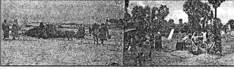
சுனாமியின் பின் கடக்கரை, தற்காலிக முகாம்களை துப்பரவு செய்யும் பணியில் பெண்களின் பங்களிப்பு (Cosh for work)

கொள்கைகளையும் தன்னகத்தே கொண்ட பல உள்ளூர் வெளிநாட்டு அரசசார்ப்பற்ற நிறுவனங்கள் சேவையாற்றத் தொடங்கியுள்ளன. இவை பெரும்பாலும் மக்களின் ஜீவனோபாயத்தை மையமாகக் கொண்ட திட்டங்களை நடைமுறைப்படுத்தினாலும் மறுபக்கத்தில் பெண்களை வலுப்படுத்தி (Empower) அவர்களின் வாழ்க்கைத்தரத்தை உயர்த்துவதற்கான செயற்பாடுகளை மட்டுமன்றி அவர்கள் தமது சக்தியை உணர்த்துவதற்கான விழிப்புணர்வுக் கருத்தரங்குகள், பொது நிகழ்ச்சிகளில் பங்கு பற்றுதல் போன்ற செயற்பாடுகளை நடைமுறைப்படுத்தி வருகின்றமை இவ்விடத்தில் குறிப்பிடப்பட வேண்டியதொரு அம்சமாகும். இதனால் ஏற்பட்ட மாற்றங்கள்.