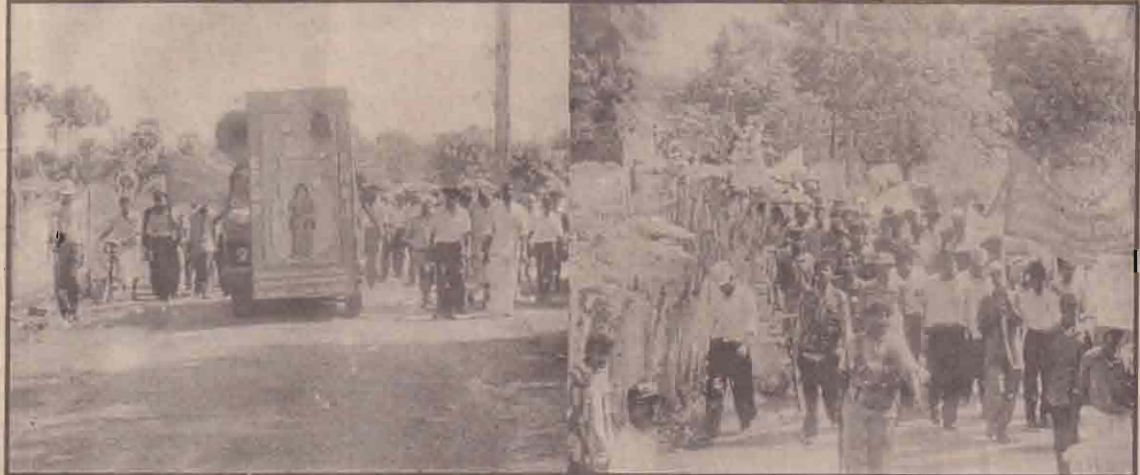
ச.பி.டி.பி. அமைப்பினால் ஏற்பாடு செய்யப்பட்ட மேதீனப் பேரணி நேற்று தீவகத்தில் நடைபெற்றது. வேலணை ஊர்காவற்றுறை பகுதியில் நடத்தப்பட்ட பேரணியின் போது எடுக்கப்பட்ட படங்கள் இவை.

தமிழர் ஒருவர் தம்முடன் போதியளவு நிதி எடுத்து வராததால் தாம் கொண்டு வந்த புத்தம் புதிய பி.ஏ.ம்.டி.பி.யு. காரை அப்படியே அன்பளிப்பாக வழங்கினார். வெற்றிவிழா இசை நிகழ்ச்சிகளில் பங்குபற்ற வந்திருந்த பெண்களில் பலர் தங்களின் தங்க நகைகளை அப்படியே கழற்றி அன்பளிப்பாக வழங்கிப்பதாக கொழும்பு ஆங்கில வார இதழ் ஒன்று தெரிவித்தது. (ஐ-4)