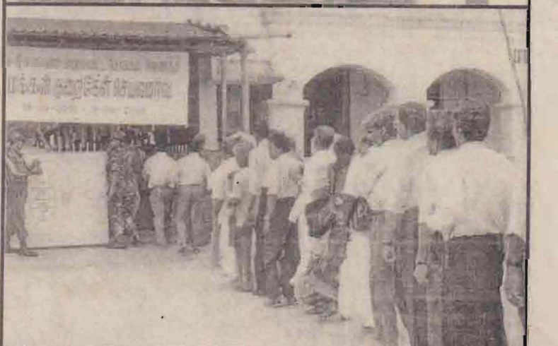
யாழ். மத்திய கல்லூரியில் நேற்று நடந்த மக்கள் குறைகேள் செயலம்வின் போது யாழ். அரசு அதிபர் க.சண்முகநாதன் மக்களின் குறைகளைக் கேட்பதை மேலேயுள்ள படத்திலும், அதில் பங்குபற்ற மக்கள் வரிசையில் சென்றுகொண்டிருப்பதைக் கீழேயுள்ள படத்திலும் காணலாம்.