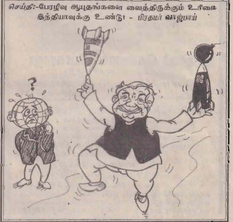
செய்து-பேரழிவு ஆயுதங்களை வைத்திருக்கும் உரிமை இந்தியாவுக்கு உண்டு - பிரதமர் வாஜ்பாய்

தானப் படையை கண்காணிப்பில் ஈடுபடுத்தியிருந்தது. முன்னர் ராணுவ வீரர்களையும், ரௌடிகளையும் கொண்ட "வெஸ்ட்சைட் போய்ஸ்" என்ற குழு சமாதான முயற்சிகளுக்கு உட்பட மறுத்து வருகின்றனர். ஒரு சமயம் இவர்கள் நூற்றுக்கணக்கான ஐ.நா. படையினரைக் கைதுசெய்து பின்னர் விடுவித்திருந்தனர். 1997இல் ராணுவ ஆட்சியில் ராணுவத்தில் பணிபுரிந்த இவர்கள் 98ஆம் ஆண்டு தமக்கெதிரான பொது மக்களின் கைகளையும் பாதுகாக்கும் துண்டித்ததும், ஆபிரிக்க சமாதானப்படையினர் ஆட்சியை விட்டு விரட்டிய சமயம் இந்தக் குழுவின் மூன்று வாரங்களில் ஆயிரக் கணக்கான மக்களைக் கொன்று குவித்ததும் குறிப்பிடத்தக்கது. (ஒ-4)