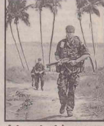
தீவிரவாதிகளின் முகாமை நோக்கிப் பிரிட்டிஷ் படையினர் முன்னேறும் காட்சி.