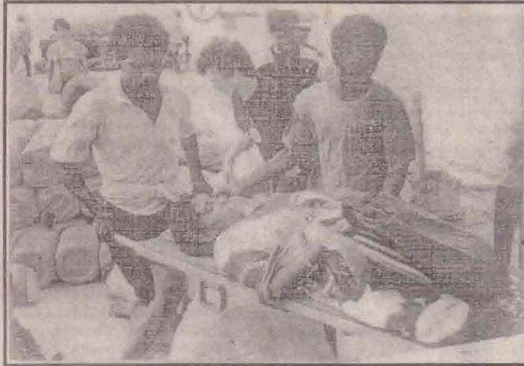
யாழ்ப்பாணம் ஒருவர் கம்பலுக்கு அழைத்துச் செல்லப்படுகிறார்.

இரு தரப்பினரையும் சர்வதேச மனிதாபிமானச் சட்டவிலக்களை அனுசரித்து நடக்கும்படி வேண்டுகோள் விடுத்தது. எனினும், நாம் இக்காலப்பகுதியில் எதிர்நோக்கிய ஒரு பின்னடைவு யாதெனில் உக்கிரமான புத்தம் இடம்பெற்ற வலயங்களுக்கு அருகே பெருமளவு மக்கள் வசித்த விசாலமான பிரதேசங்களுக்குச் சென்று பணியாற்றப் பாதுகாப்புக் கெடுபிடிகள் தடையாக இருந்தமையாகும். உதாரணமாக தென்