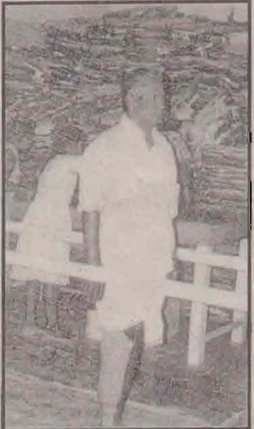
போரின் பல கொடும் விளைவுகளில் ஒன்று. ஒரு காலை கிழந்து செயற்கைக் காலுடன் எழுந்து நிற்கும் ஒருவர்.

கடும்புத்தத்தின் விளைவாக ஆயிரக்கணக்கான மக்கள் தமது