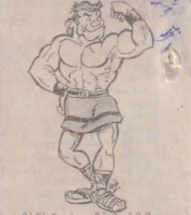
ஒலிம்பிக் போட்டிகளில் வெற்றி பெறவதை விட பங்குபற்றுகே முக்கியமான என்னும் குறிக்கோளில் வெற்றியைத் தேடிச்சிலாள்ள வீரர்கள் முனவது காலம் காலமாக நடந்துவரும் வருகிறது.

சிட்யூஸ், அல்டியூஸ், போர்டியிஸ் என்னும் மூன்று கிரேக்க வார்த்தைகளும் ஒலிம்பிக்கின் குறிக்கோளை உணர்த்துகின்றன. முன்னர் இவற்றுக்கு முறையிய வேகம், உயரம், துணிச்சல் என்றும் தற்போது முறையே பறத்தல், உயரம், வலிமை என்றும் பொருள் கொள்கின்றார்கள். இக்