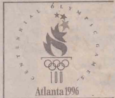
நவீன ஒலிம்பிக் போட்டிகள் ஆரம்பித்து 100 ஆண்டுகள் நிறைவடைந்ததையொட்டி அமைக்கப்பட்ட சின்னம்.

சிட்னி ஒலிம்பிக் போட்டிகளில் நேறைய நிலவரப்படி பதக்கப்பட்டியலில் அமெரிக்கா 4தங்கம், 5வெள்ளி, 2வெண்கலப்பதக்கங்களுடன் முதலாம் இடத்திலும், பிரான்ஸ் 4தங்கம், 6வெள்ளி, 2வெண்கலப்பதக்கங்களுடன் இரண்டாம் இடத்தில் உள்ளன. ஆஸ்திரேலியா, சீனா ஆகியநாடுகளும் பதக்கங்களை வென்றிருந்த நாடுகளில் முன்னிலையில் உள்ளன.