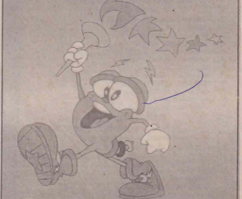
அட்லாண்டாவில் நடைபெற்ற ஒலிம்பிக் போட்டிகளுக்காக அமெரிக்க நாட்டின் ஒலிம்பிக் சபையினரால் அறிமுகப்படுத்தப்பட்ட விசேட ஒலிம்பிக் சின்னம் 'இஸ்ஸி' (IZZY).

டன் புராதன ஒலிம்பிக்கின் சரித்திரம் நிறைவுபெற்றது. ஒலிம்பிக் போட்டிகளை மறுபடியும் ஆரம்பிப்பதற்காக கிரேக்க