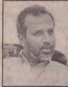
முஸ்லிம் காங்கிரஸின் இணைத் தலைவர்