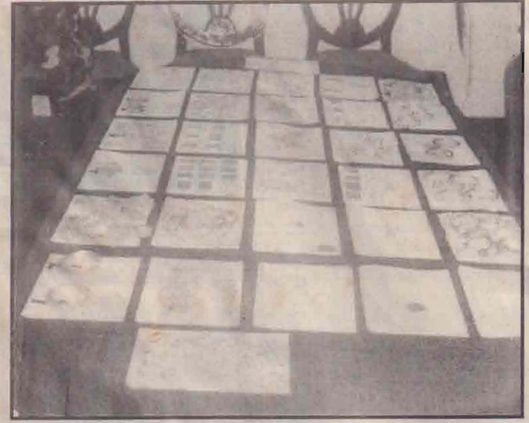
நல்லூர்ப் பகுதியிலுள்ள வீடு ஒன்றில் புகைத்து வைக்கப் பட்டிருந்த சட்டி ஒன்றிலிருந்து படையினரால் 1995 ஆம் ஆண்டு மீட்கப்பட்ட நகைகளைக் காண்கிறீர்கள். பலாலப் படைத்தளத் தில் நேற்று இடம்பெற்ற கையளிப்பு வைவத்தில் அவை பார் வைக்கு வைக்கப்பட்டிருந்தன.

கொடிய போர் அகன்று இயல்பு வாழ்க்கை ஏற்பட்டு தமிழ் மக்கள் அனைவரும் அமைதியாக வாழ இத்தேர்தல் இறைவனின் ஒரு கரு வியாக மாற இறை ஆசீர் வேண்டு கிறோம் - என்று தெரிவித்துள்ளார்.