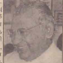
முஸ்லிம் சமூகங்களுக்கிடையிலான இறதக் கலவரங்களினால் நேற்றுக்காலை வரை காத்தாங்குப பகுதியில் வசிக்கும் ஐ.தே. கட்சி ஆதரவாளர்கள் இருவரும், முஸ்லிம் பக்கம் பார்க்க