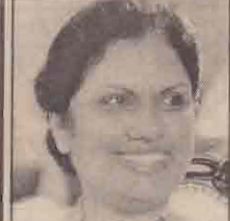
செவ்வாய்க்கிழமை நடைபெற்ற தேர்தலில் பொதுமக்கள் ஐக்கிய முன்னணியே அதிக ஆசனங்களைப் பெற்றதால் ஈ.பி.டி.பி. அரசு அமைக்க முழு ஆதரவு வழங்க உறுதியளித்ததால் -

கொழும்பு, ஒக்ரோபர் 13 புதிய அரசாங்கத்தை அமைக்குமாறு பொதுமக்கள் ஐக்கிய முன்னணியின் முத்த தலைவரும், இப்போதைய பிரதமருமான ரத்னசிறி விக்கிரமநாயக்காவுக்கு ஜனாதிபதி சந்திரிகா நேற்று அழைப்பு விடுத்தார்.