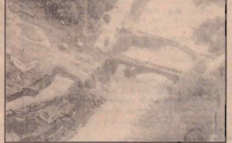
ஐரோப்பாவில் ஏற்பட்டுள்ள வெள்ளப்பெருக்குக் காரணமாக பல அழிவுகள் ஏற்பட்டுள்ளன. கவீந்தர்லாந்தில் கிராமம் ஒன்றில் மழையினால் ஏற்பட்ட நிலச்சரிவைக் காட்டும் படம் கிது.

கட்ஜு பகுதியிலும் தற்போது ஆள்கள் நடமாட்டமுடையதால் நிலவுவதால் அங்கு இந்திய ராணுவம் கண்காணிப்பை வெகுவாகக் குறைத்துள்ளதாகவும் பாகிஸ்தானியப் படைகள் இச்சந்தர்ப்பத்தை பயன்படுத்தியிருக்கலாம் என்றும் இராணுவ ஆய்வாளர்கள் கருதுகின்றனர். (ஒ-8)