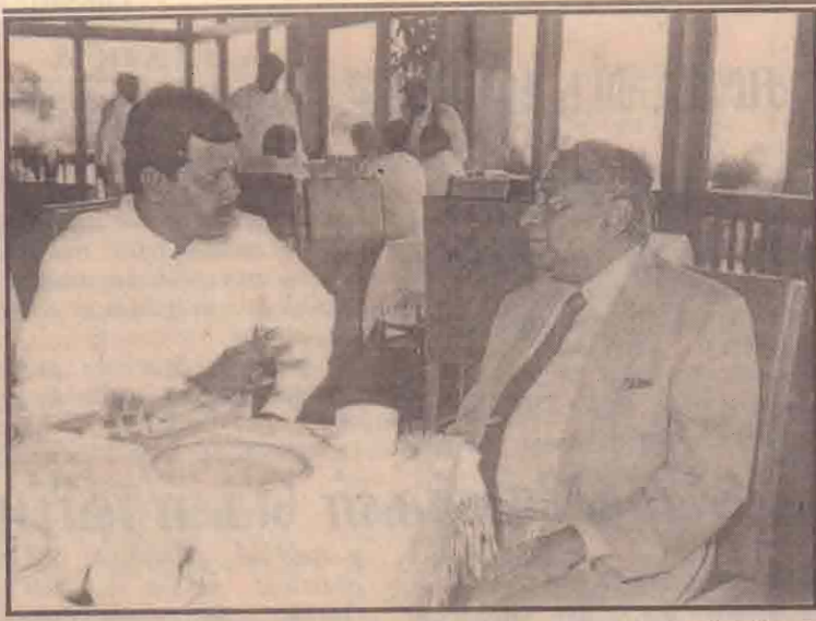
யாழ். மாவட்ட ஐ.தே.க. நாடாளுமன்ற உறுப்பினர் தி.மகேல் வரன் விவளிவகார அமைச்சர் லக்ஷ்மன் கதிர்காமரை நாடாளுமன்றக் கூட்டத்தில் சந்தித்துப் பேசியபோது எடுக்கப்பட்ட படம். (செய்தி முதலாம் பக்கத்தில்)