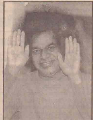
பாபாவின் அவதார நாள் இன்று

ராகவும் தாயன்பும் தந்தையின் உறுதியும் குருவின் ஞானமும் தெய்வத்தின் அருளுமாகிய நான்கும் ஓர் உருவாகக் கொண்டு "பிரேமசக்தியாக" பகவான் அவதரித்துள்ளார். நிலை குலைந்தள்ள உலகை மீண்டும் சீர்செய்யவே மனித இயல்பு ஆனந்தமே என்பதை உணர்த்தவே பகவான் அவதாரம் செய்துள்ளார். "சாயி" என்னும் நாமம் தரித்து