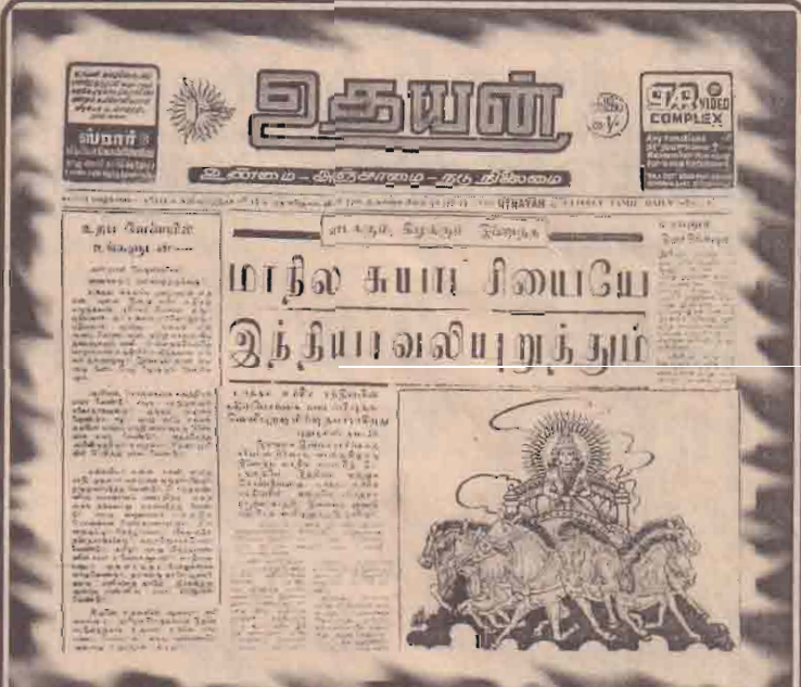
15 வருடங்களுக்கு முன் உதயனின் முதலாவது இதழ்

கொழும்பு, நவ.27 ஜனாதிபதி செயலகத்தின் அறிவுறுத்தலுக்கு அமைய, பதில் பாதுகாப்பு அமைச்சராகப் பிரதமர் ரத்னசிற்றி வீக்கிரமநாயக்க சத்தியப்பிரமாணம் செய்துகொண்டுள்ளார். பாதுகாப்பு அமைச்சப் பொறுப்பு (9ஆம் பக்கம் பார்க்க)