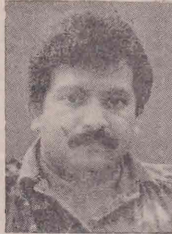
கொழும்பில் உள்ள சட்டத்துறை அதிகாரிகளுடனும் ஏனைய அதிகாரிகளுடனும் வே. பிரபாகரனைக் கைது செய்துகொண்டு வருவதற்கான வழிமுறைகள் குறித்து பேச்சு நடத்தினர். அதேசமயம் - தமிழ்நாட்டில் உள்ள விடுதலைப்புலி ஆதரவாளர்களை மத்திய அரசு உன்னிப்பாகக் கவனித்து வருகின்றது. தமிழ்நாட்டு கரையோரப் பகுதிகளில் புலிகளின் கடத்தல் நடவடிக்கைகள் இடம்பெற்று வருவதாக எமக்குத் தகவல் கிடைத்துள்ளது. விடுதலைப் புலிகள் ஆதரவு அமைப்புக்களான தமிழ்நாடு விடுதலைப் படை, தமிழ்த் தேசிய மீட்புப்படை போன்ற அமைப்புகளைத் தடை செய்வது குறித்தும் மத்திய அரசு ஆராய்ந்து வருகிறது. இப்படி அவர் மேலும் கூறினார். (ம-8)

குழு அமைக்கப்பட்டது. கொழும்பு சென்ற இக் குழுவின் அதிகாரிகள்