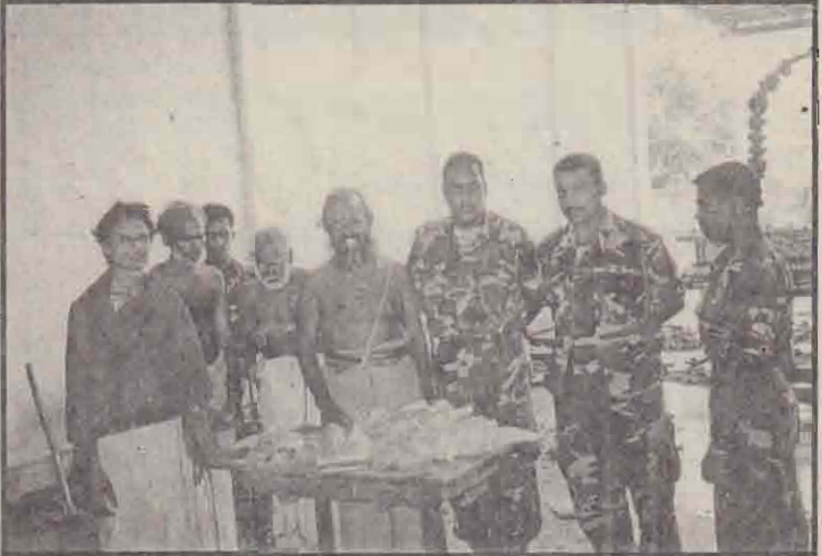
மட்டுவில் பன்றித்தலைச்சி அம்மன் ஆலயத்தில் இருந்து அண்மையில் படையினரால் மீட்கப்பட்ட ஒன்றரை வட்சம் சூபா பணம் மற்றும் ஒரு தொகுதி தங்க நகைகள் கோயில் நிர்வாகத்திடம் ஒப்படைக்கப்பட்டன.

நாடாளுமன்ற உறுப்பினர் தி.மகேஸ்வரன் வண்டிலைச் செலுத்திச் செல்கிறார். (ஐ)