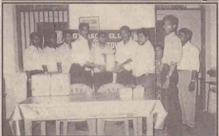
யாழ். கல்வியியல் கல்லூரியினால் அனுப்பப்பட்ட நூலகவாரியைக் கைவாங்கிய யாழ்ப்பாணம் மாவட்ட அரசுத் துறைமுகத்தில் சேகரிக்கப்பட்ட ஒரு தொகுதி நூல்கள் பொறுப்பாளியாகவும், அகியானிக் கப்பட்ட சமயம் எடுக்கப்பட்ட படம் இது. (ஐ)