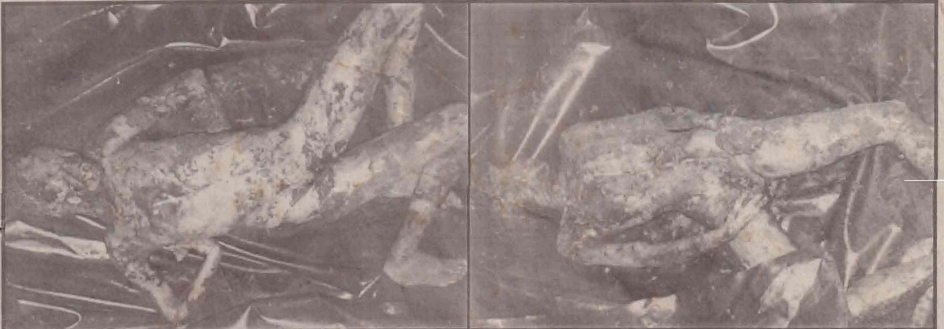
மிருகவில் வடக்கில் படித்த மகளிர் குடியேற்றத் திட்டப் பகுதியில் நேற்றுமுன்தினம் தோண்டப்பட்ட மனிதப் புதைகுழியிலிருந்து மீட்கப்பட்ட சடலங்களில் கிரன்டை மேலே படங்களில் காணலாம். மீட்கப்பட்ட எட்டுச் சடலங்களும் பருத்தித்துறை ஆதார வைத்தியசாலையில் நேற்று வைக்கப்பட்டிருந்த சமயம் எடுக்கப்பட்ட படங்கள் இவை. (மேலும் படங்கள் 11ஆம் பக்கத்தில்)

இன்று மூன்று விமான சேவைகள் யாழ்ப்பாணம்,டிசெ.27 காலநிலை சீராக இருக்கும் பட்சத்தில் இன்று மூன்று விமான சேவைகள் இடம்பெறும் என்று யாழ்ப்பாணம் நிர்வாக அலுவலகம் அறிவித்துள்ளது. முதலில் வருபவருக்கு முதல் இடம் என்ற அடிப்படையில் பயணிகள் அனுப்பப்படுவர் என்றும்- பயணிகளை அனுப்பும் பணி காலை 6 மணி முதல் யாழ்ப்பாணம் நிர்வாக அலுவலகத்தில் ஆரம்பிக்கும் என்றும் - அறிவிக்கப்பட்டுள்ளது.