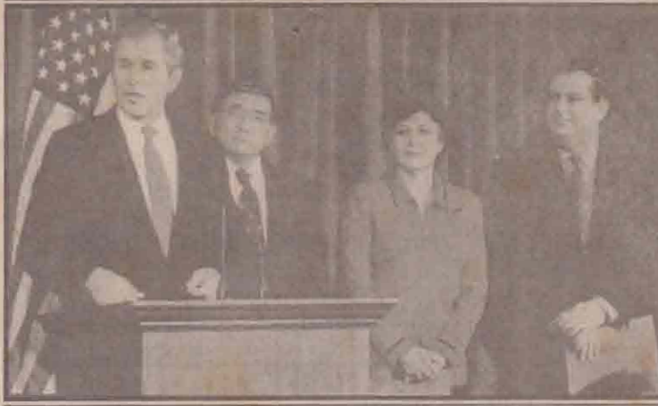
அமெரிக்காவின் புதிய அதிபர் ஜோர்ஜ் புஷ் தனது அமைச்சரவையை அறிவித்த போது எடுக்கப்பட்ட படம். அமைச்சர்களான நோர்மன் மினோரா, லின்டா சாவேஸ், ஸ்பென்ஸ் ஏபிரகாம் ஆகியோர் உடன் உள்ளனர்.