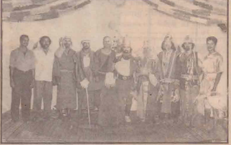
யாழ். ஸ்ரீலங்கா ரெலிக்கொம் நிறுவனம் நடத்திய ஒளிவிழா நிகழ்வுகள் அண்மையில் யாழ். பலநோக்குக் கூட்டுறவுச் சங்கத்தின் கேட்போர் கூட மண்டபத்தில் வெகு விமரிசையாக நடைபெற்றன. இந்த விழாவின் சிறப்பு நிகழ்ச்சியாக 'விடியலின் பூபாளம்' என்னும் நாடகத்தில் பங்குபற்றிய ரெலிக்கொம் நிறுவன கலைஞர்களை படத்தில் காணலாம். (ஐ-17)