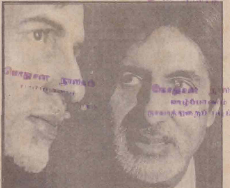
பிரபல இக்தி நடிக்கர் அமிர்தாப் பச்சன் இம் மெய்யுரு உருவச் சிலை லண்டனில் உள்ள 'மேடம்' காட்சியகத்தில் அமைக்கப்பட்டுள்ளது. உலகில் முக்கிய பிரமுகர்களின் மெய்யுரு சிலைகள் இக்காட்சியகத்தில் உள்ளன. தனது உருவச் சிலையை அமிர்தாப் பச்சன் பார்வை மீடுவதை படத்தில் காணலாம்.

தலிபான் ஆட்சியாளர்களுக்கு எதிராக ஐநா உறுதித்துள்ள தடையை பாகிஸ்தான் செயற்படுத்தும் என்று பாகிஸ்தான் வெளிவிவகார அமைச்சர் அப்துல் சதார் தெரிவித்தார். தலிபான்களுக்கு ஆயுதங்களை வழங்குவது, விற்பது தடை செய்யப்படும். தலிபான் தூதர்களை முடிவிடுவது போன்ற தடைகளை ஐநா அண்மையில் விதித்திருந்தது. இந்தத் தடை இந்த மாதம் 19 ஆம் திகதி அமுலுக்கு வருகின்றது. இவற்றைப் பாகிஸ்தான் உரிய முறையில் அமுல்படுத்தும் என்றும் அவர் தெரிவித்தார். (ம)