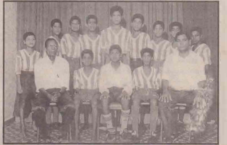
தேவரையானி இந்து அணி