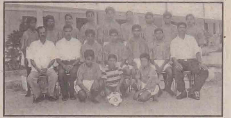
உடுப்பிட்டி அமெரிக்கன் மிஷன் அணி

பலம் வாழ்ந்த இரு அணிகள் மோதும் இன்றைய ஆட்டம் ரசிகர்களுக்குப் பெருவிருந்தாக அமையப் போகின்றது என்பது உண்மை. உதைபந்தாட்டத்தின் தரத்தை அபிவிருத்தி செய்யும் தனது திட்டத்தில் கணிசமான வெற்றியைக் கண்டு வரும்பருத்தித்துறை உதைபந்தாட்ட லீக் அடுத்து வரும் காலங்களில் மேலும் வெற்றிகளை எட்டும் என நம்பிக்கை கொண்டு லீக் செயற்படுவதாக லீக்கின் அதிபர் ஒருவர் தெரிவித்தார். (உ-3)