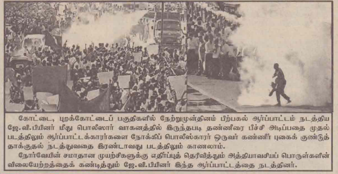
கோட்டை, புறக்கோட்டைப் பகுதிகளில் நேற்றுமுன்தினம் பிற்பகல் ஆர்ப்பாட்டம் நடத்திய ஜே.வி.பி.யினர் மீது பொலீஸார் வாகனத்தில் கிருந்தபடி தண்ணீரை பீச்சி அடிப்பதை முதல் படத்திலும் ஆர்ப்பாட்டக்காரர்களை நோக்கிப் பொலீஸ்காரர் ஒருவர் கண்ணீர் புகைக் குண்டுத் தாக்குதல் நடத்துவதை கிரண்டாவது படத்திலும் காணலாம். நோர்வேயின் சமாதான முயற்சிகளுக்கு எதிர்ப்புத் தெரிவிக்கும் அத்தியாவசியப் பொருள்களின் விலையேற்றத்தைக் கண்டித்தும் ஜே.வி.பி.யினர் கிந்த ஆர்ப்பாட்டத்தை நடத்தினர்.

கொழும்பு, ஜன.10 "புறக்கோட்டைப் பகுதியில் ஆர்ப்பாட்டம் நடத்திய ஜே.வி.பி. கட்சியின் ஆதரவாளர்கள் மீது பொலீஸார் நடத்திய தாக்குதலுக்கு எதிராக நீதிமன்றம் செல்ல இருக்கின்றோம்." - இவ்வாறு நேற்று நடைபெற்ற செய்தியாளர் மாநாட்டில் உரையாற்றிய ஜே.வி.பி.யின் பிரசாரச் செயலர் விமல் வீரவன்ச - தெரிவித்தார். இது தொடர்பாக அவர் மேலும் தெரிவித்ததாவது:- பொலீஸார் எமது ஆதரவாளர்கள் மீது கண்முடித்தமையாக நடத்திய தாக்குதலை எமது கட்சி வன் (14ஆம் பக்கம் பார்க்க)