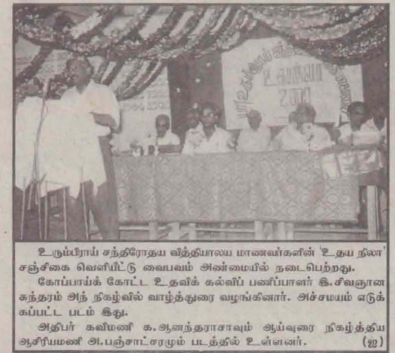
உரும்பியா சந்திரேதய வித்தியாலய மாணவர்களின் 'உதய நலா' சஞ்சிகை வெளியீட்டு வைபவம் அண்மையில் நடைபெற்றது.