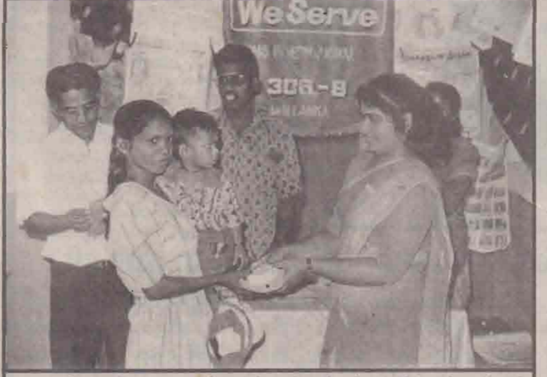
மருத்துவபீட மாணவர்களின் ஏற்பாட்டில் வயிற்றோட்ட நோய் சம்பந்தமான கருத்தரங்கு அண்மையில் கோப்பாய் சூசையப்பர் ஆலயப் பகுதியில் கிடம்பெற்றது. இக் கருத்தரங்கின் கிறிதியில் லயன்ஸ் கழகத்தின் உதவியுடன் சவர்க்காரம் வழங்கப்பட்டது. கருத்தரங்கில் கலந்துகொண்ட தாய் ஒருவருக்கு யாழ்.மருத்துவபீட மாணவீ ஒருவர் சவர்க்காரம் வழங்குவதைப் படத்தில் காணலாம்.

நல்லை ஆதீன முதல்வர் ஆசீபுரை வழங்குவதையும் நகுலேஸ்வரக் குருக்கள் தம்பதியினர் மேடையில் வீற்றிருப்பதையும் படத்தில் காணலாம். (ஐ)