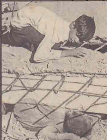
குச் மாவட்டத்தில் ஓரிடத்தில் விட்டின் கட்டட இடிபாடுகளில் சிக்கி உயிரிழந்திருக்கும் தனது சகோதரியின் சடலத்தைப் பார்த்தவாறு, இடிபாடுகளுக்கு நடுவில் சிக்கிக் காணாமல்போன தாயைத் தேடும் ஓர் (அனாதைச்) சிறுவன்!

இடிபாடுகளுள் சிக்கியிருப்பவர்களைக் கண்டுபிடிப்பதற்காக மோப்பநாய்களும் பயன்படுத்தப்படுகின்றன. பாதிக்கப்பட்ட பகுதிகளில் சகல ஆஸ்பத்திரிக் கட்டடங்களும் தகர்ந்து போய்விட்டதால் இந்திய இராணுவத்தினரும் ஏனைய மருத்துவ அதிகாரிகளும் ஆங்காங்கே வீதிபோரத்திலும், பொதுஇடங்களிலும் உட்கொண்டுவந்து ஆஸ்பத்திரிகளில் வைத்து, பூமியதிர்ச்சியில் காயமடைந்தோருக்கு சிகிச்சை அளிக்கப்படுகின்றது. பாதிக்கப்பட்ட இடங்களுக்கு நிவாரணப் பொருள்களை அனுப்பும் பணியும் ஓரளவு முன்னேற்றம் கண்டிருப்பதும் பக்கம் பார்க்க (16ஆம் பக்கம் பார்க்க)