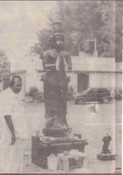
ஆஞ்சநேயர் விக்கிரகம் தமிழகம் ஏற்றப்படுவதற்காக தயாராக வைக்கப் பட்டபுஷணம் எஸ். முத்தையா ஸ்தப

மருதனார் மடத்திலோர் கோயிலு மாருதிக் கடவுளுக்கு குடமு திருமகள் மாப்பின் அனுமனை தேசத்தின் காவல் பொறுப்பு தருணமதில் சமாதானத் தூது தமிழரின் உரிமையைச் சேர்த்து கருணை வள்ளலை அடைக்கக் காவல் செய்யென மன்றாடி - மதுரகவி காரை. 6