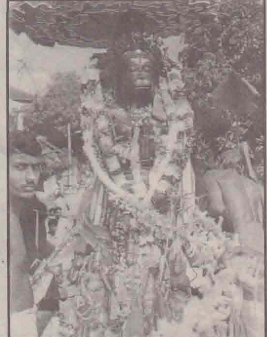
தமிழகத்திலிருந்து கொழும்புண்டாக எடுத்துவரப்பட்ட ஸ்ரீ சுந்தர ஆஞ்சநேயர் விக்கிரகம் யாழ்ப்பாணத்தில் வித்யூடாக திருஉலாவாக எடுத்துச் செல்லப்பட்டவேளை பிடிக்கப்பட்ட படம்.

முன்னொரு காலத்தில் கடுமரு மலையை கேசரி என்ற வானர அரசன் ஆண்டு கொண்டிருந்தான். அவனுடைய மகளான அஞ்சனாதேவி, புத்திர வரம் வேண்டி, சிவபெருமானை நோக்கி நீண்ட காலம் தவம் செய்தாள். அவளுடைய மன உறுதியையும் தூய் எண்ணத்தையும் கண்டு மகிழ்ந்த சிவபெருமான் அவள் கேட்ட வரத்தைக் கொடுப்பதற்குத் தீர்மானித்தார். அவ் வேளையிலே, அயோத் தியை ஆண்ட