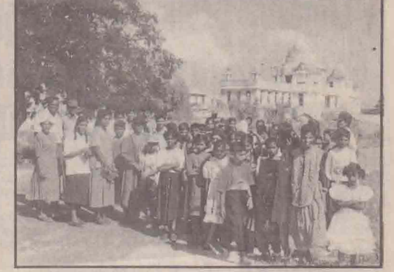
கரவெட்டி கிராமத்திலுள்ள சிறுவர்கள் சுகவாய்வு நிறுவனத்தினால் அண்மையில் கற்றுலாவுக்கு அழைத்துச் செல்லப்பட்டனர். சாட்டி கடற்கரைக்கு கூட்டிச் செல்லும் வழியில் அவர்கள் யாழ்.பொது நூலகத்தைப் பார்வையிட்டபோது எடுக்கப்பட்ட படம் கீழே. (ஐ-5)